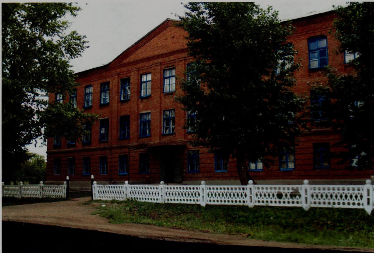
Школа №20 пос. Красноярский