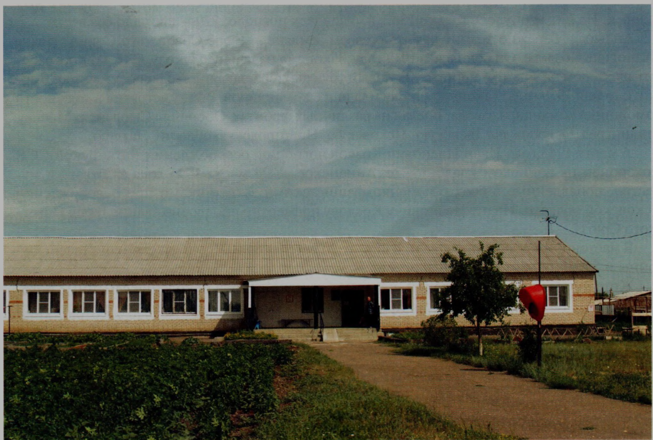
Дом милосердия в Екатериновке