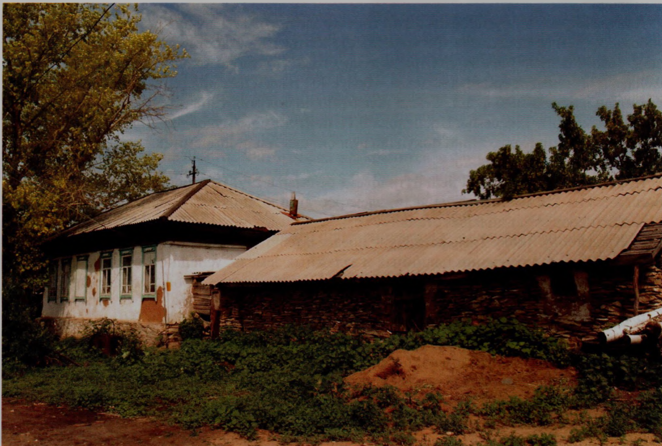
Казацкий дом в Екатериновке