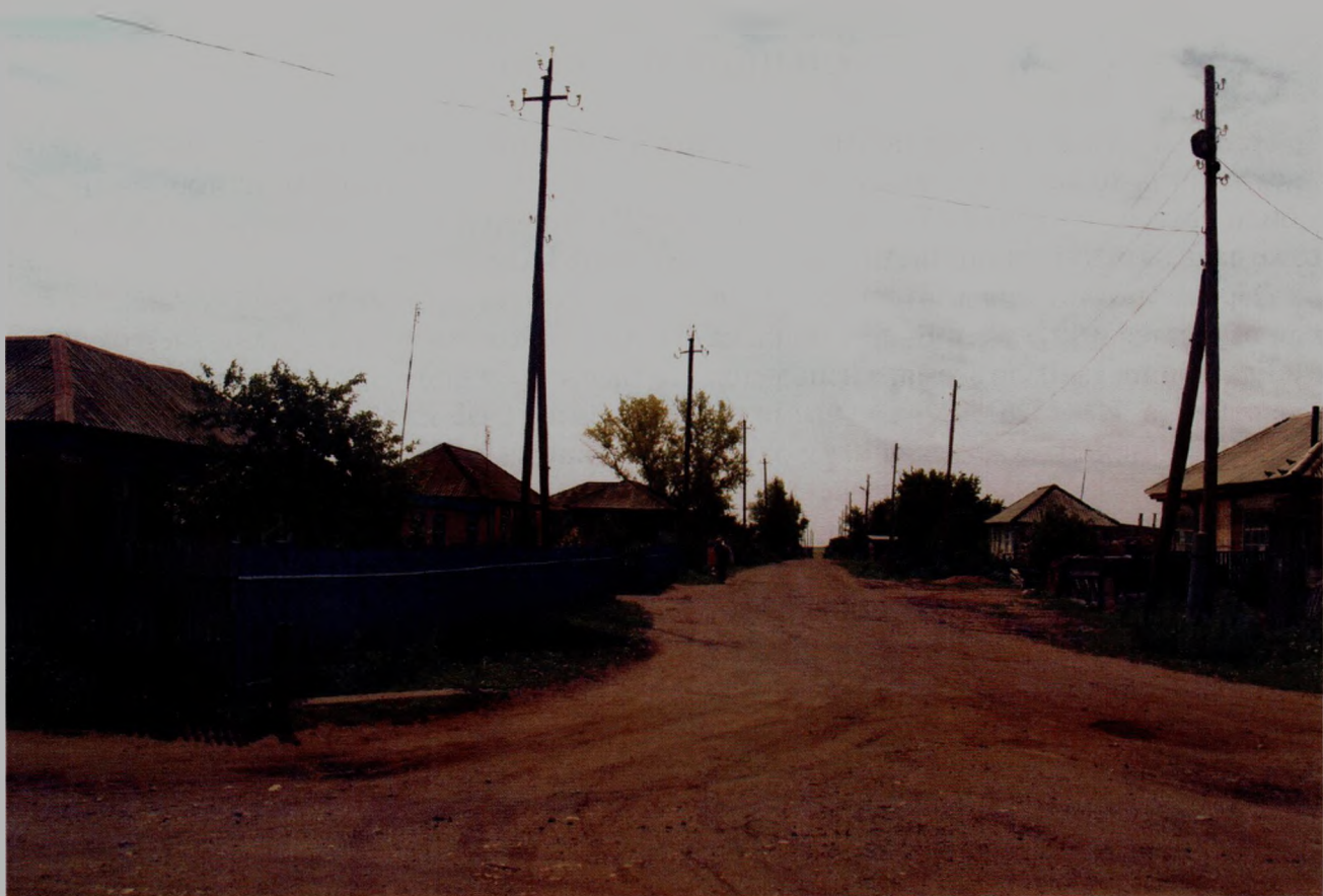
Одна из первых улиц Екатериновки