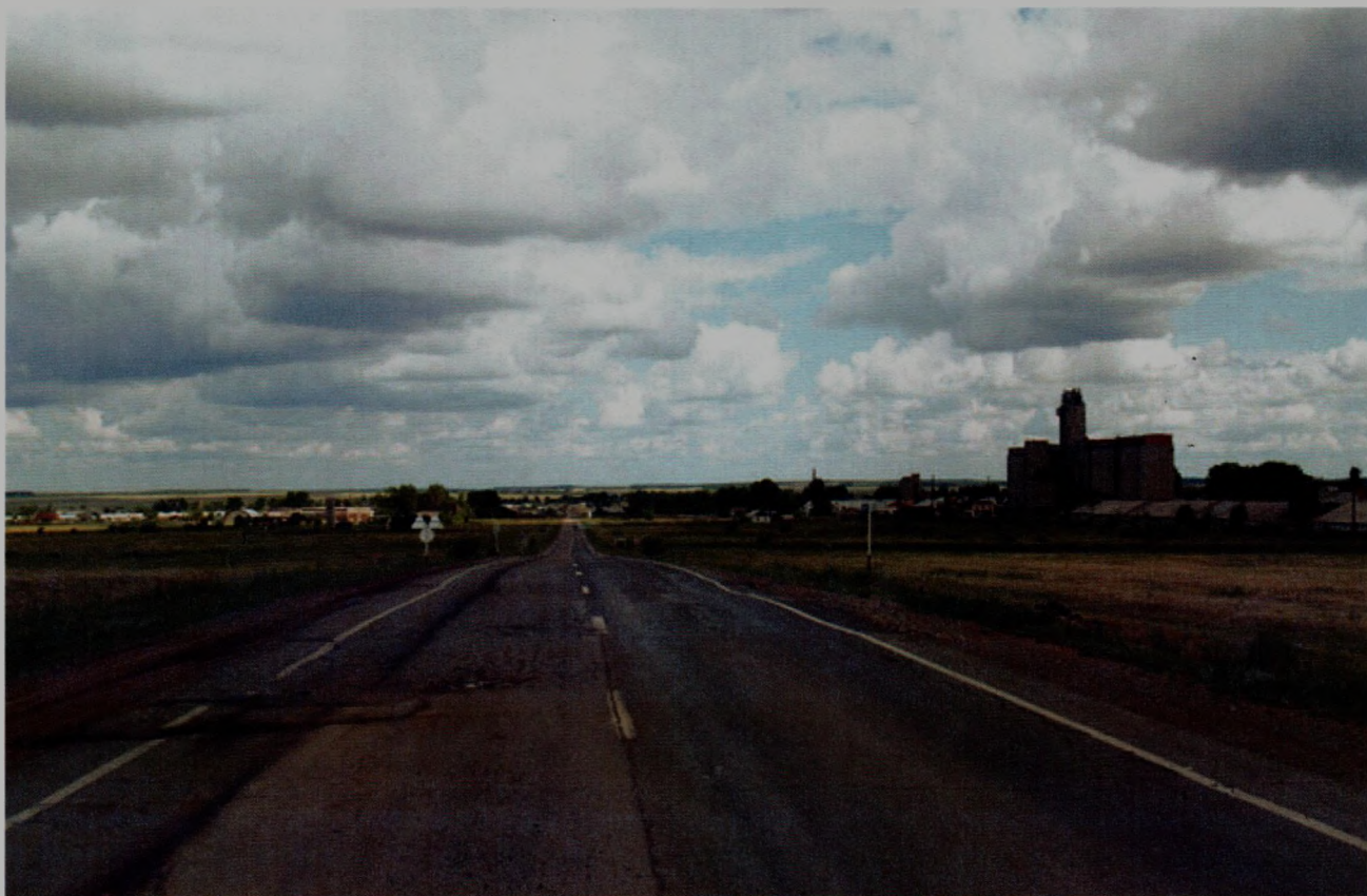
Айдырля. Вид с горы

водителем, машинистом компрессора в вагонном цехе, осмотрщиком вагонов, при этом был мастер на все руки: механик, слесарь, токарь, даже пимокат — валенки валял дома.