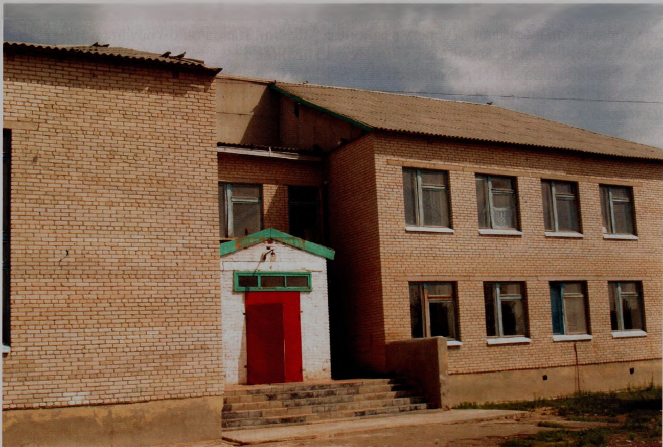
Средняя школа в Екатериновке