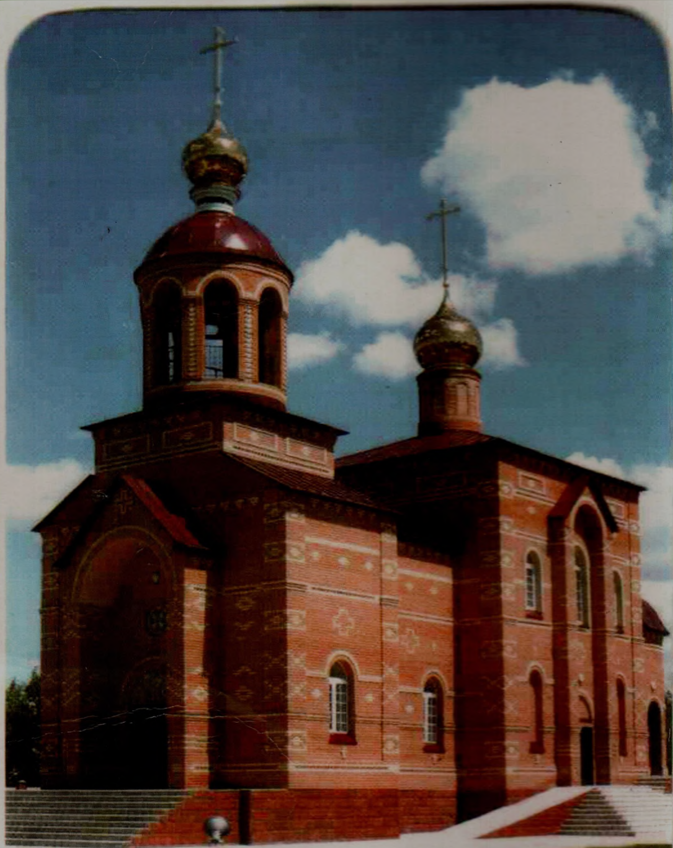
Храм Святого Георгия Победоносца (п. Красноярский, станция Айдырля)