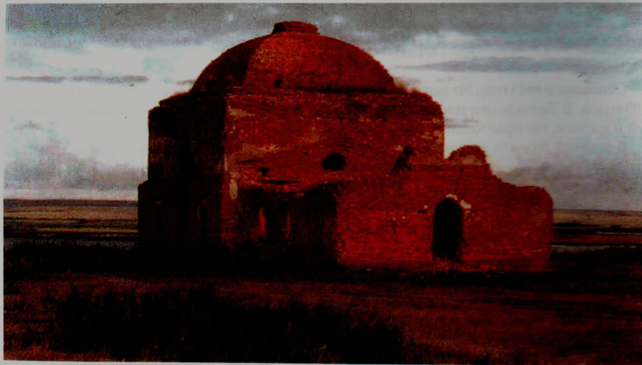
ОСТАТКИ ХРАМА XVIII ВЕКА БЫВШЕЙ УРТАЗЫМСКОЙ КРЕПОСТИ

Во второй половине XVIII века здесь построили храм из красного кирпича. Это единственный в районе храм из кирпича, каким-то чудом