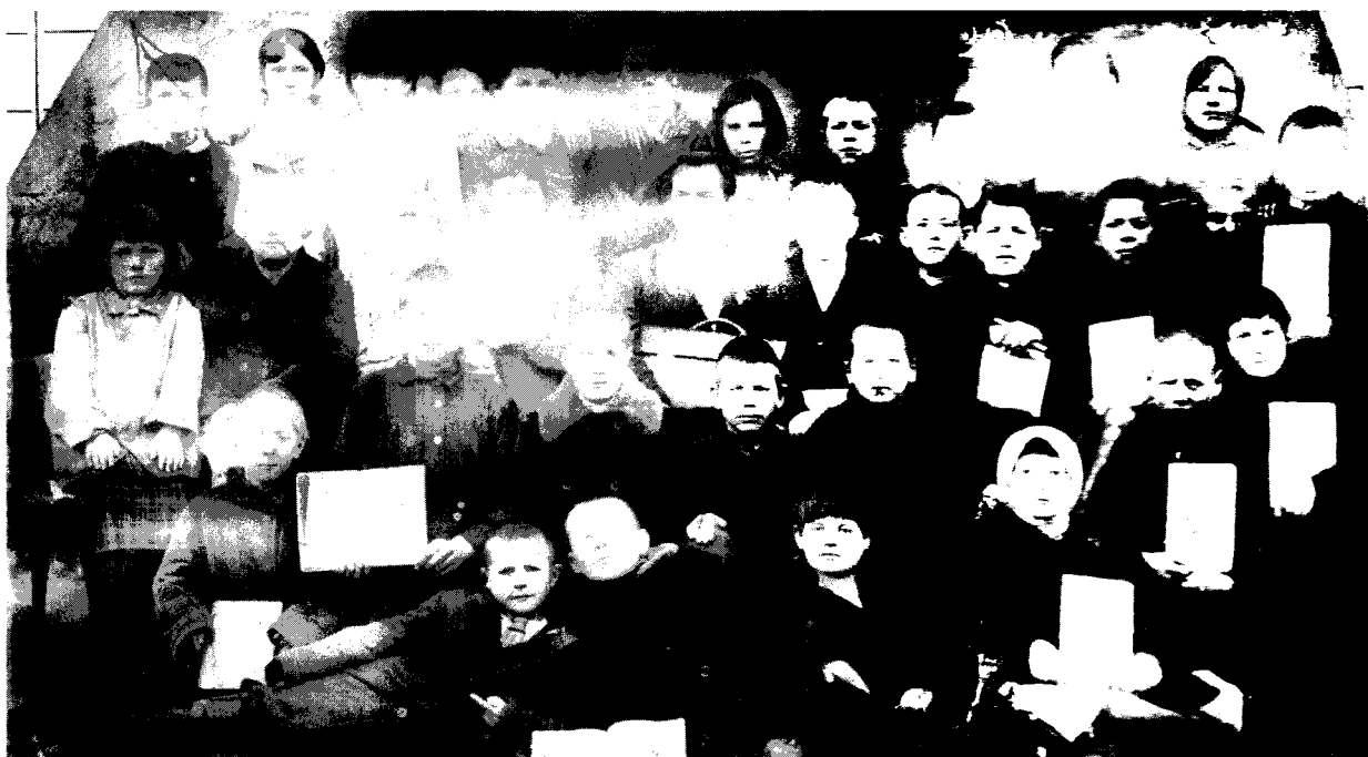
Начало 40-х годов. Учащиеся средней школы станции Айбырля

каждого жителя поселка — открытие и освящение храма в честь святого великомученика Георгия Победоносца. Он стал святым местом, символом добра и веры, нравственной опоры в благих делах.