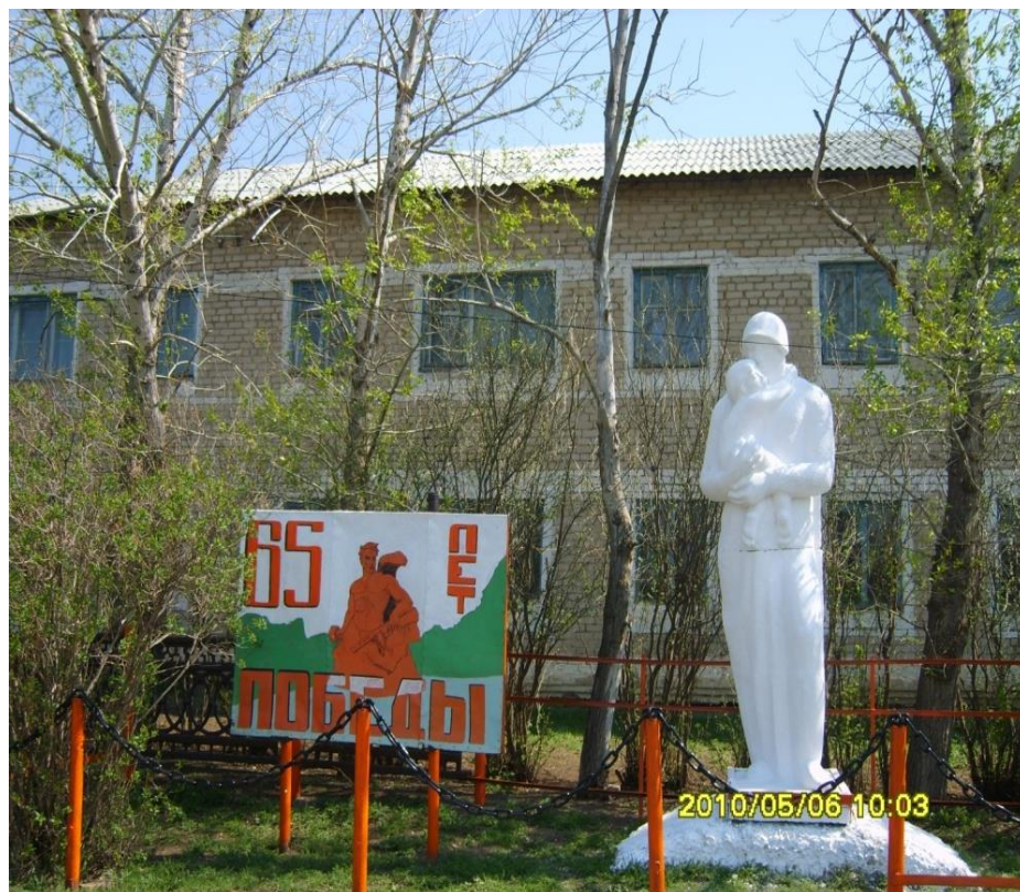
с. Кульма. Кваркенский район. Оренбургская обл.

Памятник Воину - Освободителю установлен возле здания школы. Открытие памятника состоялось в 1980 году в честь 35-летия Великой Победы. Автор памятника неизвестен.