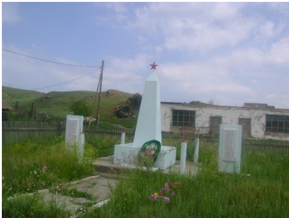
с. Березовка. Кваркенский район. Оренбургская обл.

Обелиск воинам – односельчанам, погибшим в годы Великой Отечественной войны, расположен в центре села. Его хорошо видно при въезде в село с любой стороны.