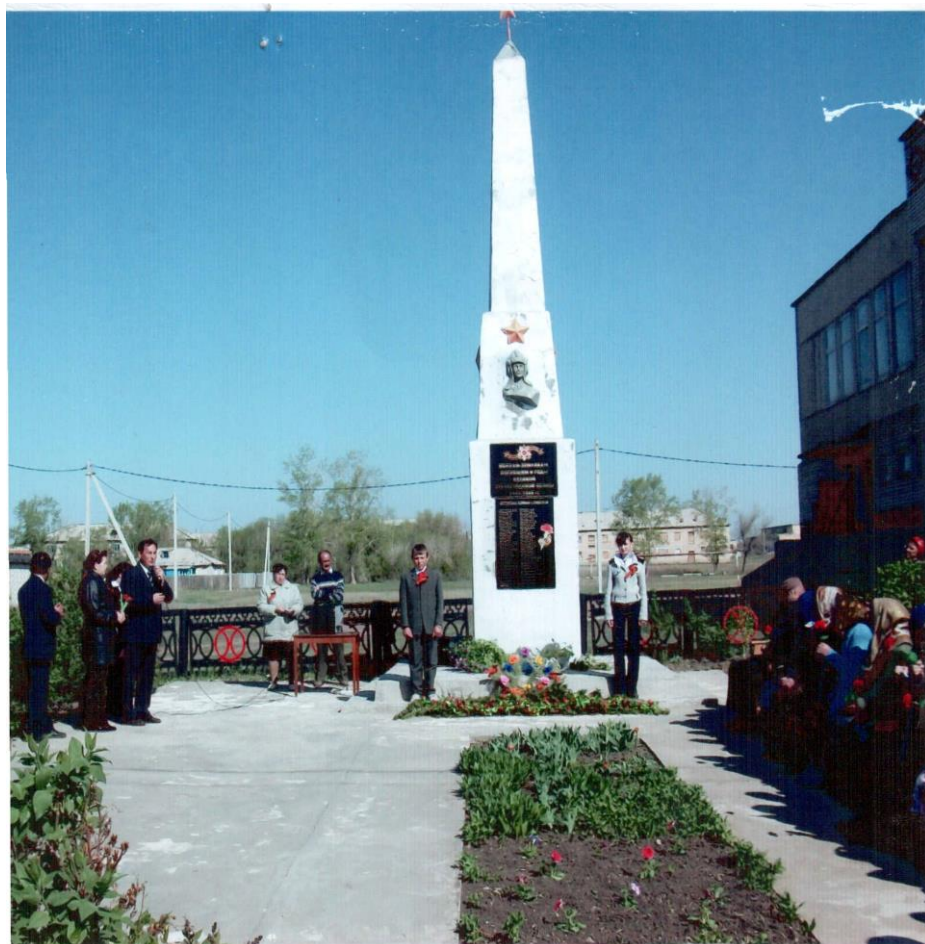
с. Таналык. Кваркенский район. Оренбургская обл.

Обелиск погибшим воинам в годы Великой Отечественной войны находится в центре села, на площади возле Дома творчества.