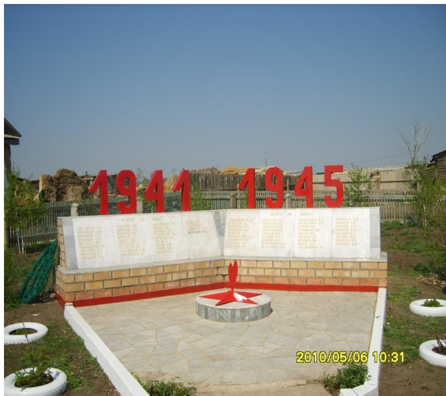
с. Новопотоцкое. Кваркенский район. Оренбургская обл.

Село Новопотоцкое своими корнями уходит в начало прошлого века. Много славных страниц в её истории и одна из них связана с Великой Отечественной войной. В то грозное время на фронт ушло около 70 жителей села, 30 из них сложили свои головы на полях сражений. Но не было в селе святого места, которое бы служило постоянным напоминанием ныне живущим о героических людях и их делах во имя будущего.