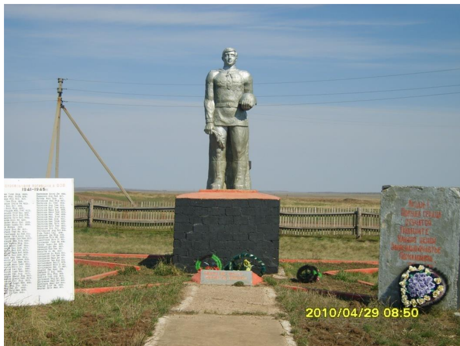
С. Екатериновка. Кваркенский р-он. Оренбургская обл.

Памятник погибшим односельчанам в с.Екатериновка установлен при въезде в село, открытие состоялось в 1981 г.к 40-летию со дня начала Великой Отечественной войны.