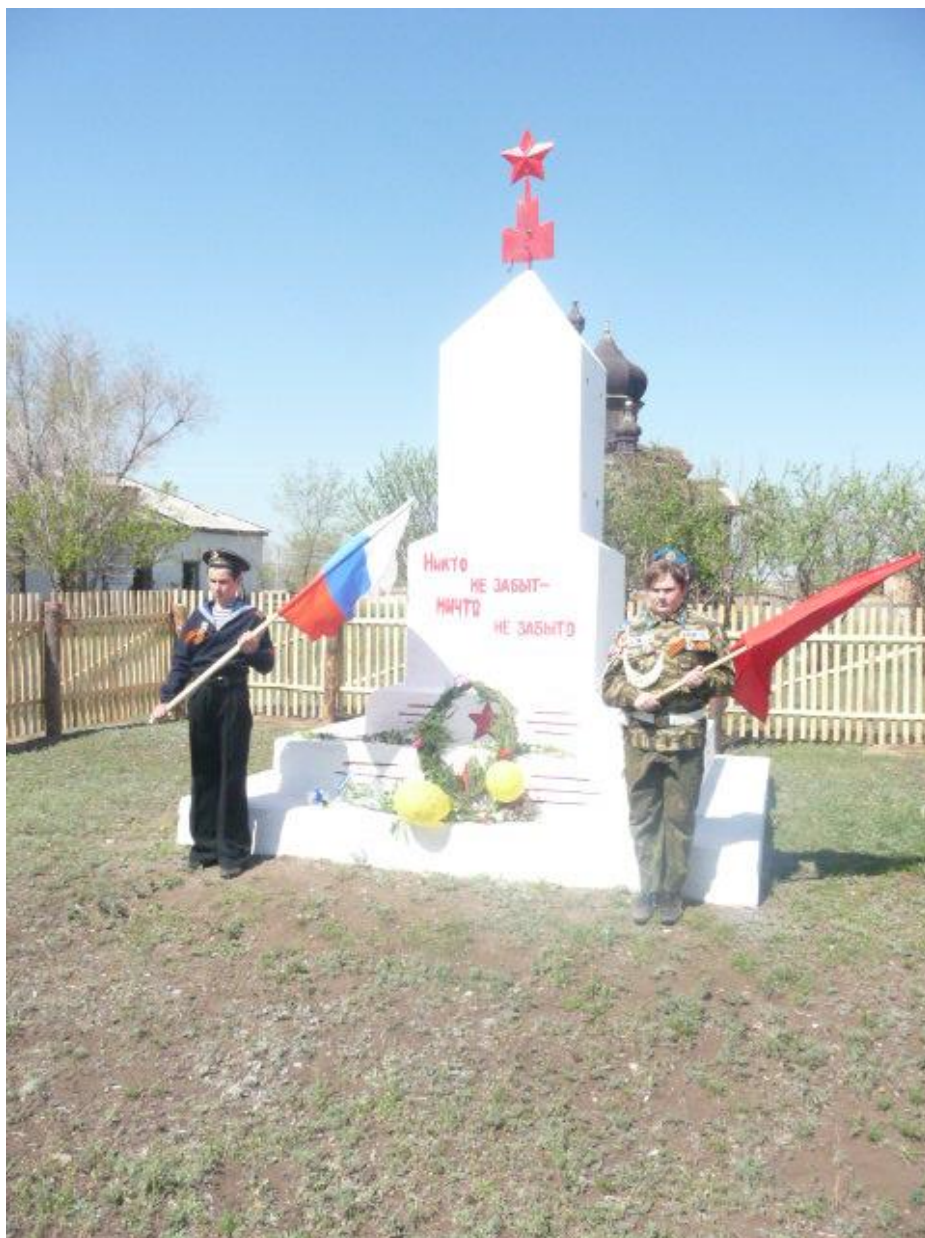
с. Покровка. Кваркенский район. Оренбургская обл.

Обелиск, погибшим воинам-землякам, участникам Великой Отечественной войны установлен в центре парка.