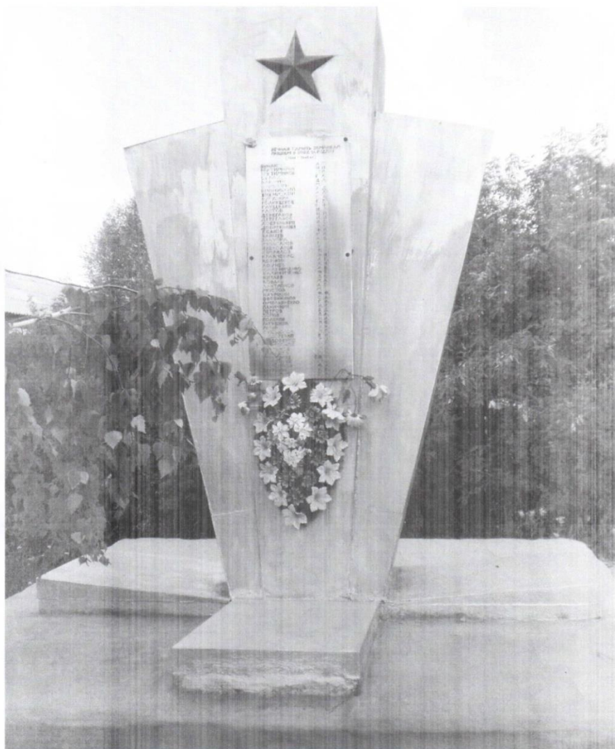
с. Свободное. Кваркенский район. Оренбургская обл.

На территории школы, которая расположена в центре села, в 1975 году был поставлен обелиск павшим воинам в Великой