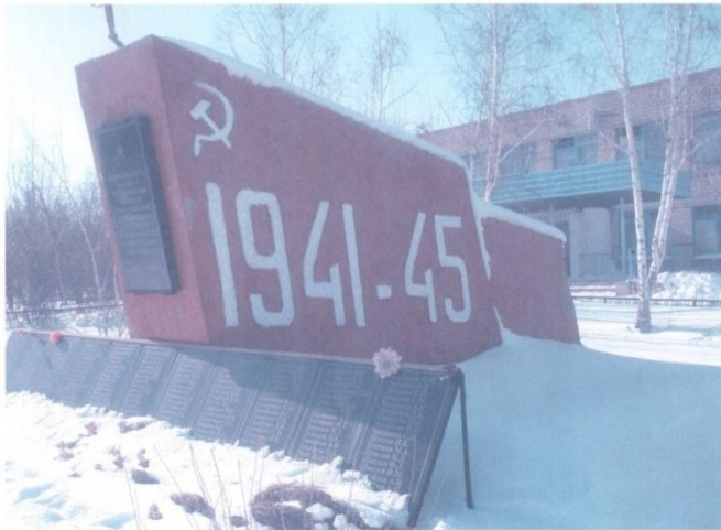
с.Аландское, ул.Школьная,3 Кваркенский район Оренбургская обл.

Памятник расположен на территории Аландской средней общеобразовательной школы.