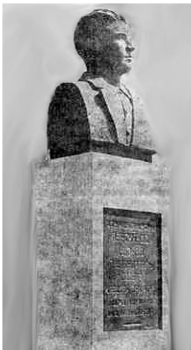
Памятник П.А. Персиянову

готовят расправу и надо покинуть Изобильную. Отряд отправился в станицу Ветлянскую. В погоню за ними бросились до 200 белоказаков во главе с полковником Донецковым.