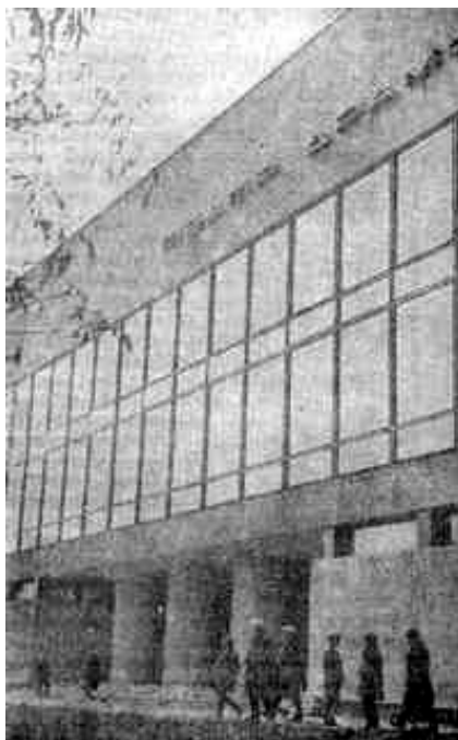
Здание Орского театра драмы имени А. С. Пушкина

«Крупнейший, многосторонне развитый промышленный центр образуется в Орском районе», — говорил на XVII съезде партии председатель Госплана СССР В. В. Куйбышев.