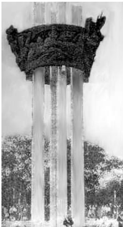
Оренбург. Памятник землякам, погибшим в борьбе за Советскую Родину в годы гражданской и Великой Отечественной войны

В своей речи перед избирателями Бауманского округа Москвы 14 июня 1974 года Леонид Ильич Брежнев говорил о том, что новый десятый пятилетний план «готовится вместе с генеральной перспективой развития народного хозяйства на 1976-1990 годы и станет ее составной частью». В генеральной перспективе важное место будет занимать Оренбургский территориально-производственный комплекс.