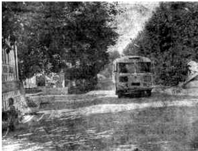
Кувандык, улица Мира

Так начинался Южно-Уральский криолитовый. В наши дни коллектив завода за счет модернизации оборудования и использования передовой технологии в два с лишним раза перекрыл проектную мощность. В самом разгаре реконструкция завода, расширяются производственные площади, обновляется оборудование. В 1976 году, когда реконструкция будет завершена полностью, мощность предприятия снова удвоится.