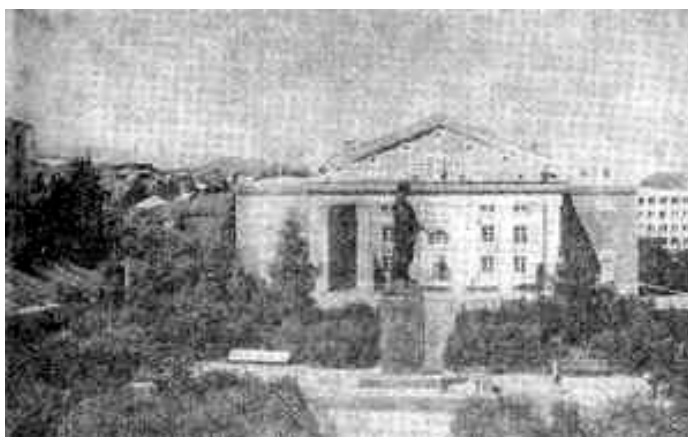
Площадь имени Ленина в Медногорске