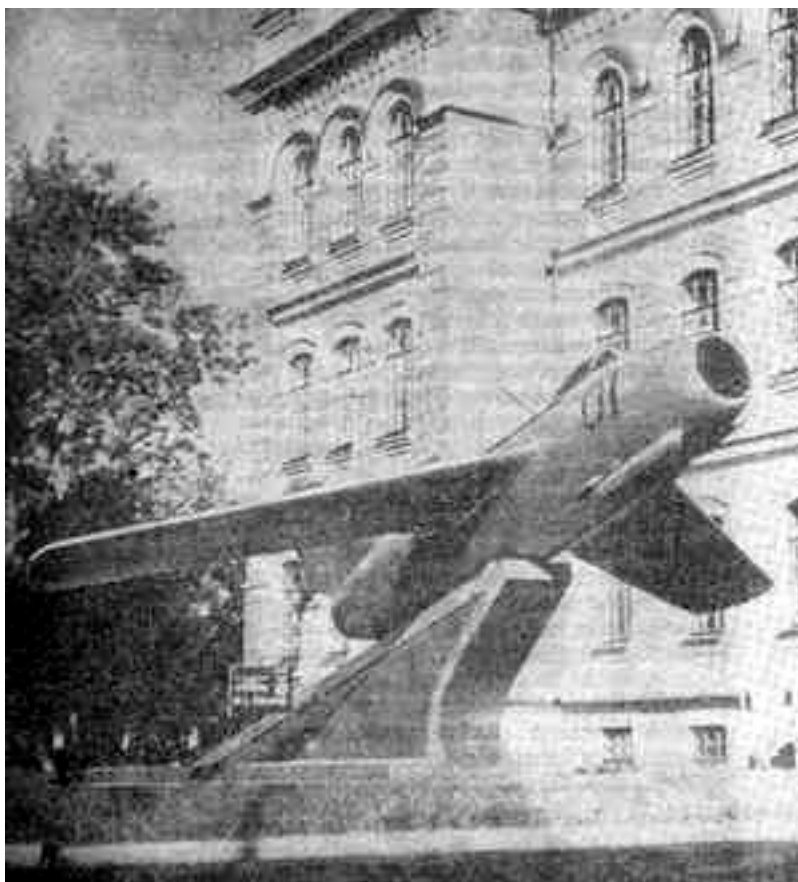
Самолет на котором летал первый космонавт мира Ю. А. Гагарин, когда был курсантом Оренбургского военно-авиационного училища