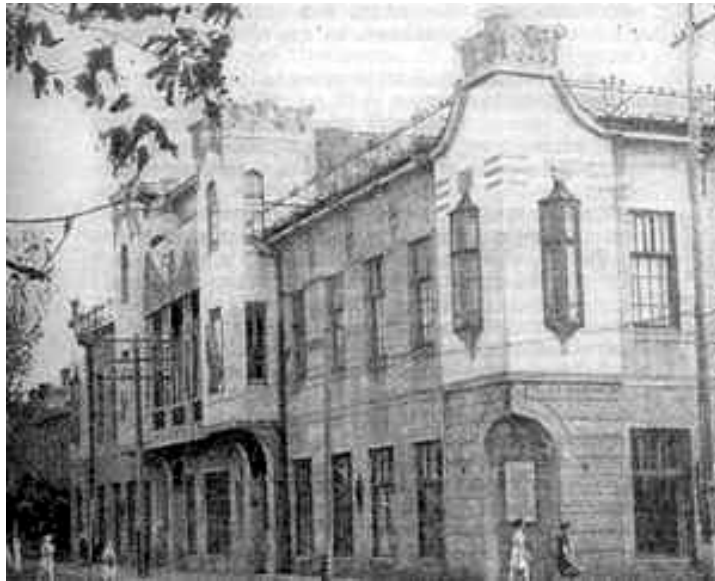
Бузулук, Дом, в котором в 1919 году размещался штаб Чапаевской дивизии