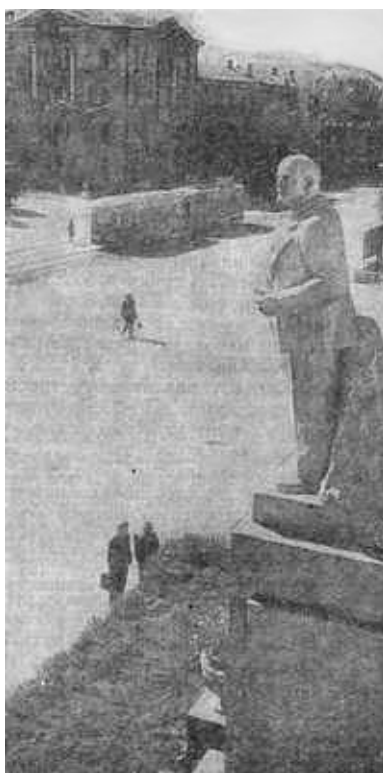
Памятник В. И. Ленину в Новотроицке

Всего 54 часа понадобилось ударным бригадам, чтобы уложить в мощный монолитный фундамент огромное количество бетона — 3200 кубометров. По норме на эту работу полагалось 78 часов. Сэкономили целые сутки.