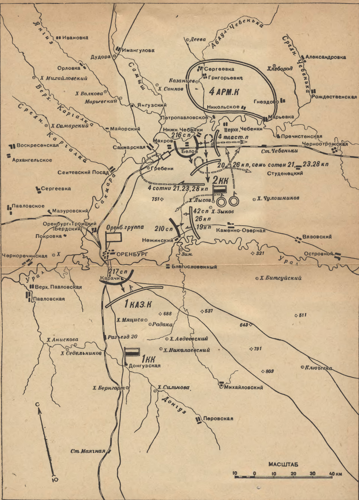
Схема 9. Бой у хутора Белов 13 мая 1919 г.