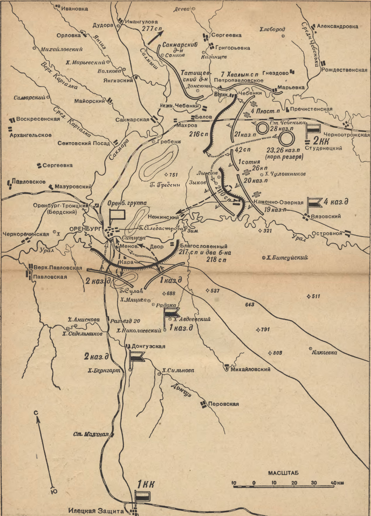
Схема 8. Наступление Оренбургской армии 9—10 мая 1919 г.