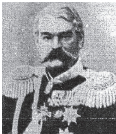
Рис. 10. Александр Андреевич Катенин

Александр Андреевич Катенин (1800–1860) правил Оренбургским краем недолго: 20 июня 1860 г. он скоропостижно скончался. Но и за это время он успел сделать немало, особенно в отношениях со среднеазиатскими ханствами [75]. При нем в Оренбургском Неплюевском кадетском корпусе опять были произведены некоторые преобразования.