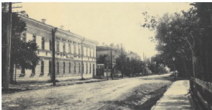
Рис. 3. Здание Оренбургского военного училища

себя руководство строительством. Нужно было действовать быстро, так как в старом здании, стремительно ветшавшем, с трудом могли разместиться учащиеся наборов 1827 и 1829 г. Поэтому срочно подвозились строительные материалы. Г. Ф. Генс доносил военному губернатору: «Если не заготовятся оные и не будут сделаны цоколь и фундамент, то едва ли здание может быть закончено в 1829 году» 28 . В действительности строительство нового дома (сейчас улица Ленинская, 25) завершилось в 1830 г. 29