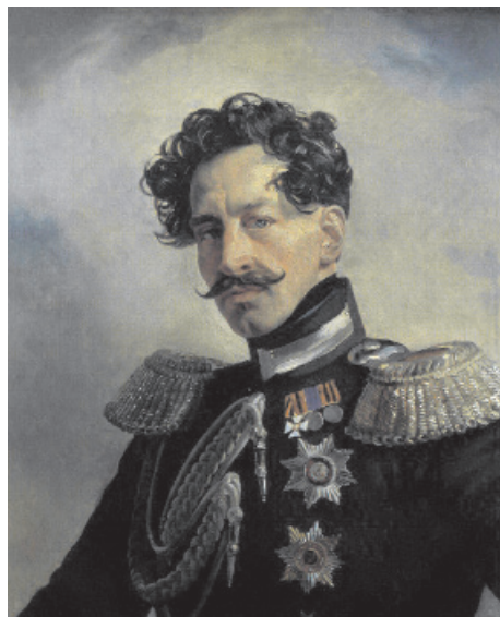
Рис. 5. Василий Алексеевич Перовский

отправился в сопровождении подобранных в столице сотрудииков. К ним принадлежал В. И. Даль, который, отказавшись от военно-медицинской службы, перешел на гражданскую и занял должность чиновника особых поручений при оренбургском военном губернаторе.