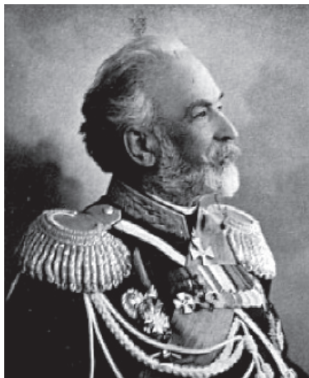
Рис. 8. Виктор Дезидериевич Дандевиль

Очередной выпуск воспитанников состоялся в 1843 г. Кроме кончивших полный курс обучения, на военную и гражданскую службу были определены некоторые ученики средних и нижних классов, «не получившие более надежды к продолжению курса по тупости способностей» 153 .