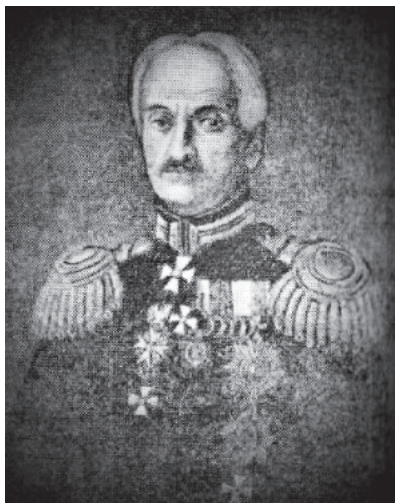
Рис. 6. Владимир Афанасьевич Обручев

В 1842 г. закончился первый период правления В. А. Перовского Оренбургским краем. Поздней осенью 1841 г. он уехал в Петербург, но оставался оренбургским военным губернатором до июня 1842 г. Затем он был уволен в «отпуск для поправления здоровья за границей», а на его должность был назначен генерал от инфантерии Владимир Афанасьевич Обручев (1793–1866). Ему предстояло управлять краем с 1842 по 1851 г.