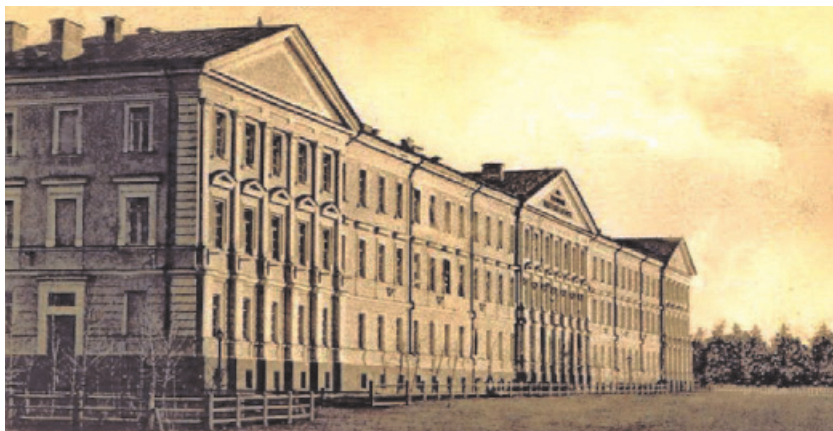
Рис. 13. Здание Оренбургской Неплюевской военной гимназии (с 1882 г. Оренбургского Неплюевского кадетского корпуса)