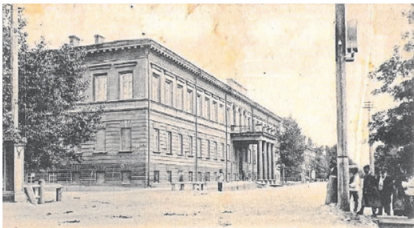
Рис. 7. Здание 2-го эскадрона Оренбургского Неплюевского кадетского корпуса

Классное обмундирование имело следующий вид: «Куртка, как и строевая, но вместо эполет погоны светло-синие с желтою насечкою букв ОН. Шаровары без лампасов. Фуражная шапка темно-зеленая с красною по верхнему ребру выпушкою и красным околышком. Шинель серого цвета с погонами. Воротник на строевой и классной куртках и на шинели красный с темно-зеленым кантом по верху. Пуговицы медные с двуглавым орлом» 144 .