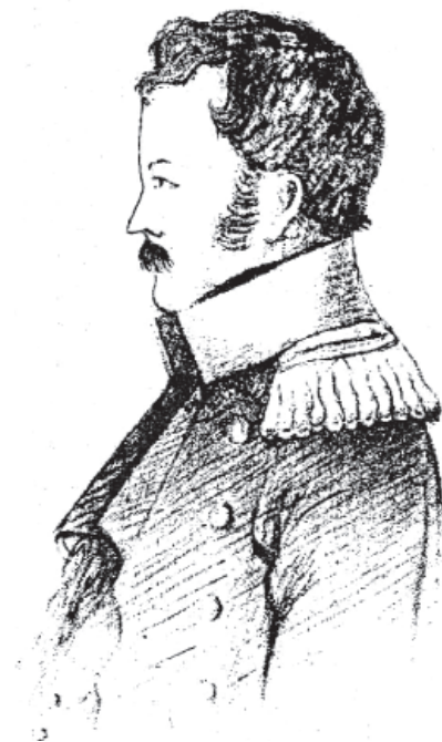
Рис. 14. Григорий Федорович Генс

Многогранная деятельность Г. Ф. Генса в Оренбурге, продолжавшаяся 38 лет, отражена в формулярном списке, который был составлен в конце его служебной карьеры, в 1843 г. 260 В этом документе значится, что председатель Оренбургской Пограничной комиссии и попечитель Оренбургского Неплюевского военного училища генерал-майор Генс, происходящий из дворян и принадлежащий к лютеранскому вероисповеданию, вступил на службу по окончании Инженерного корпуса в чине юнкера 20 ноября 1806 г. Вскоре, 3 июля 1807 г., когда ему «от роду было 20 лет», он был произведен в подпоручики и тогда же «командирован из Санкт-Петербурга в Оренбург». Это определило его дальнейшую судьбу: в Оренбурге Г. Ф. Генс остался навсегда.