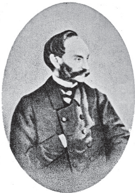
Рис. 15. Пётр Иванович Демезон

департаменте министерства иностранных дел. Другие науки он изучал, слушая лекции в Петербургском университете, и стал учеником знаменитого академика Х. Д. Френа (1782–1851).