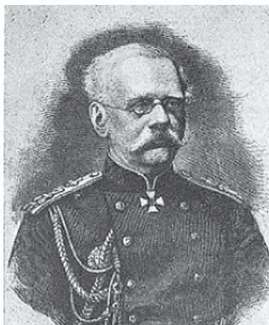
Рис. 12. Николай Андреевич Крыжановский

Между тем в жизни Оренбургского края происходили важные перемены. В 1862 г. по императорскому указу была упразднена – как «утратившая в настоящее время свое значение» – Оренбургская крепость, и срыт крепостной вал. В 1865 г. из Оренбургской губернии была выделена Уфимская, и Оренбург стал губернским городом. Появилась возможность открыть здесь гражданскую гимназию, что и произошло в 1868 г. при новом генерал-губернаторе Николае Андреевиче Крыжановском (1818–1888), вступившем в должность в начале 1865 г.