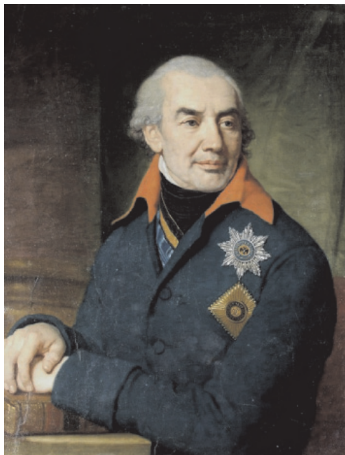
Рис. 1. Григорий Семёнович Волконский

Но в 1805 г. правительство сократило список губерний, где по царскому рескрипту 1801 г. предполагалось открыть дворянские военные училища, и Оренбургская губерния в него не попала. Поэтому Волконскому пришлось затратить немало усилий, доказывая, что Оренбург остро нуждается в «учебном заведении, приспособленном к нуждам края».