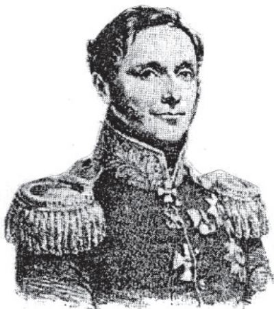
Рис. 2. Пётр Кириллович Эссен

Петр Кириллович Эссен (1742–1844), правивший в Оренбургском крае с 1817 по 1830 г., вскоре после своего приезда в Оренбург направил военному министру донесение о необходимости скорейшего открытия Неплюевского училища, причем представил финансовые расчеты и план деятельности учебного заведения [70, с. 43–47].