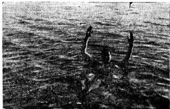
Соленое озеро «Тузлучное». Куланше больного.

На берегу «Тузлучного» озера стоит дома Соль-Илецкого курорта.