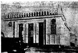
Клуб в Илецкой защите.

На южной стороне поселка имеется трехэтажный корпус — это гордость Илецкой защиты — новая районная больница. С больничного двора видна железнодорожная ветка, по которой маленький паровоз тащит