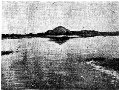
Вид на соляное озеро и соляную гору.

шое бревно, окованное на одном конце железом. Ударами „барса“ глыбы соли выламывались, затем дробились на более мелкие комья и складывались в бунты. Соль в бунтах доставлялась или вручную на тачках или наждами на плечах. Даже такой примитивный способ, как удары „барса“, уже представлял собою некоторую „механизацию“ и облегчал труд. В большинстве же случаев выламывание соляных глыб производилось при помощи железных клиньев, забиваемых под низ соляного косяка. Потом глыбу выворачивали деревянными вагами и разбивали на комья.