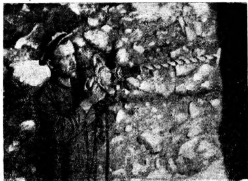
Буряльщик Илецкого солярудника в забое.

Работа идет полным ходом. И то, что три десятка лет назад требовало каторжного труда сотен людей, теперь с успехом делают двенадцать-двадцать пять человек. Разбросанные на обширнейшей площади рудника, они занимаются каждый своим делом, терпят в огромных камерах, штреках, и рудник кажется пустынным.