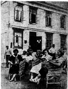
Соль-Илецкий курорт. Здание курзала