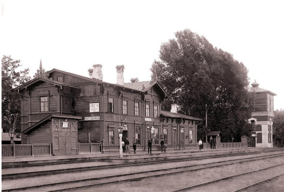
Станция Колтубанка, 1912 год.