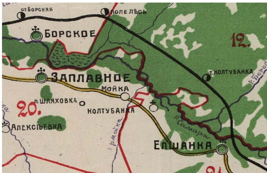
Колтубанка в составе Елишанской волости, карта 1912 года.

14 июля 1920 года в результате Сапожковского восстания станция Колтубанка была захвачена восставшими и разобран железнодорожный мост через реку Боровку.