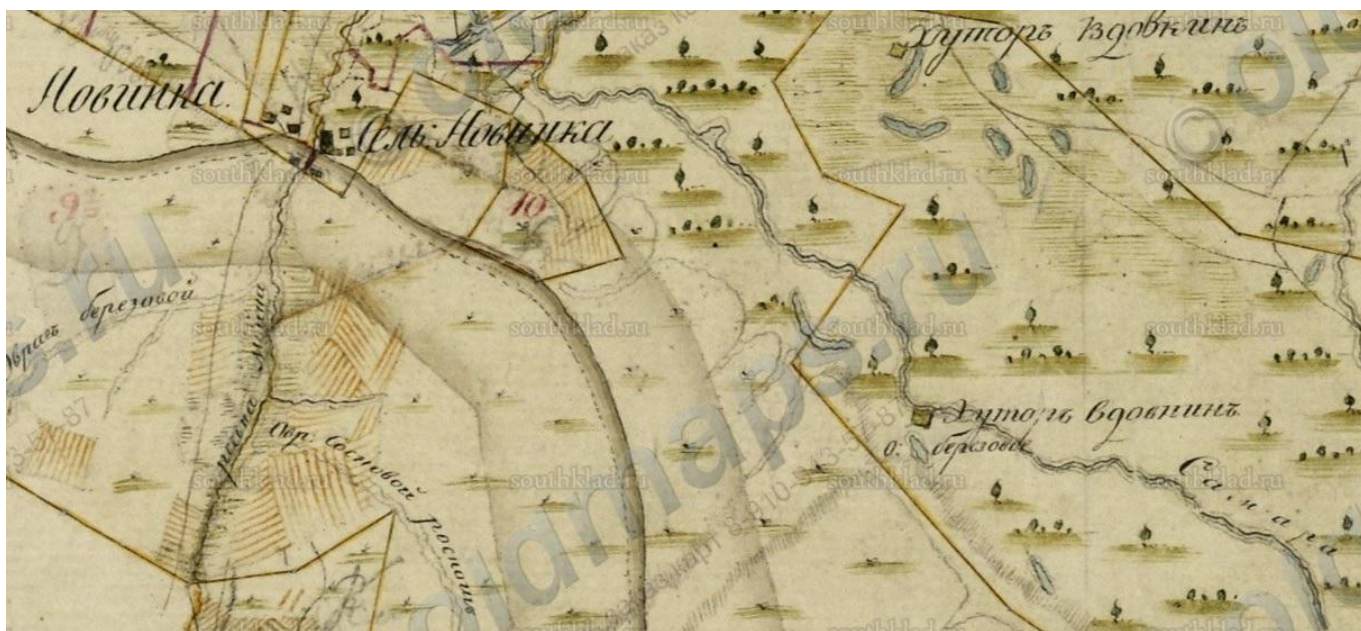
Карта 1805 года. Около хутора Вдовкина, что около р.Самары появится Колтубанка.

В метрических книгах, ревизских сказках и других документах встречаются разные названия села: Колтубанка, Колтубановка, Котлубановка, Кутлубаний, Кутлубановка.