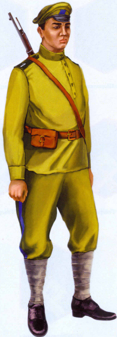
Рядовой 1-го Башкирского пехотного полка образца сентября 1918 г.