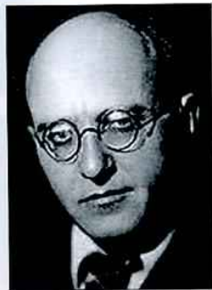
Чулаки М.И., композитор, возглавлял Ленинградский государственный академический малый оперный театр