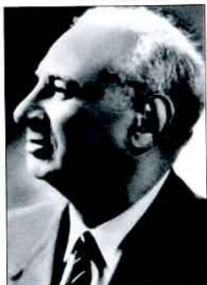
Хайкин Б.Э., дирижер, художественный руководитель и главный дирижер Ленинградского государственного академического малого оперного театра http://bse.sci-lib.com/article030186.html