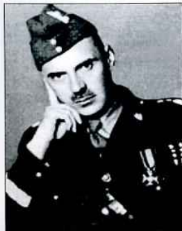
Андере В., генерал польской армии