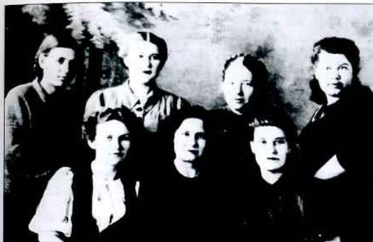
Группа сотрудниц ЦСБ, г. Бутурусаны, 1943 г.

ГАОО, ф. р-1465, оп. 1, д. 300, л. 12. 12 об.