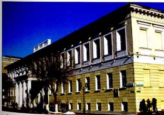
Здание школы № 30, в котором в 1941–1945 гг. размещался звакогоспіталь № 1658, г. Оренбург. Фото 2010 г.