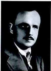
Дзержинский И.И., композитор

http://www.sovmusic.ru/person.php?idperson=31