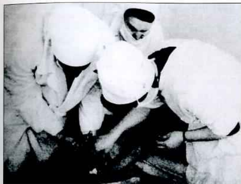
Военный госпиталь в Медногорске Промышленность Оренбуржья – фронту! – Оренбург, 2005