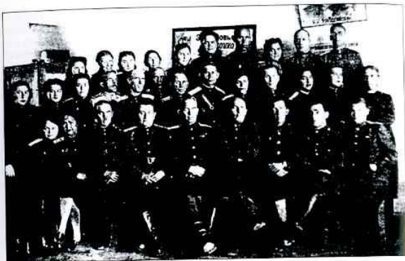
Персонал звакогоспітала № 3323, г. Сорочнік Архіўны аддзел адміністрацыі МО Сорочнінскі раён, ф. 22, сп.1, д. 48