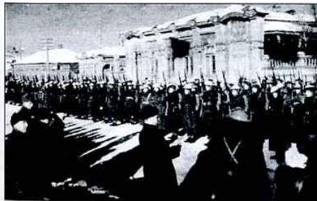
Прощание I чехословацкого самостоятельного полевого батальона в СССР с г. Бузулуком, 30 января 1943 г. Брож М. Военные документы рассказывают. – Прага, 2007