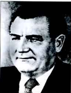
Тотвалды К., Президент ЧССР, в 1938-1945 гг. возглавлял Заграничное бюро ЦК КПЧ. В 1942 г. находился в Бузулуке Филиал ГАОО в г. Бузулуке, ф. р-1, оп. 1, П-196

7. Квартала в Чкаловский с 1 Комиссариат показаны на вас бы