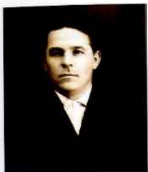
Дубровский А.А., первый секретарь Чкаловского обкома ВКП(б) (1938–1942) ЦДНИОО, ф. 371, оп. 26, д. 3267, л. 3