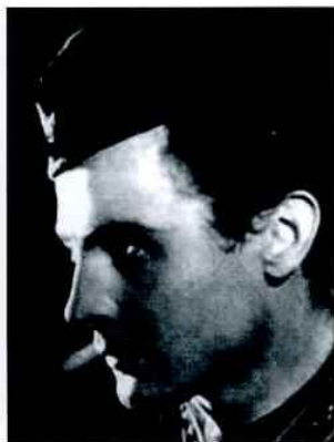
Фатьянов А.И., поэт http://www.sovmusic.ru/person.php?idperson=79