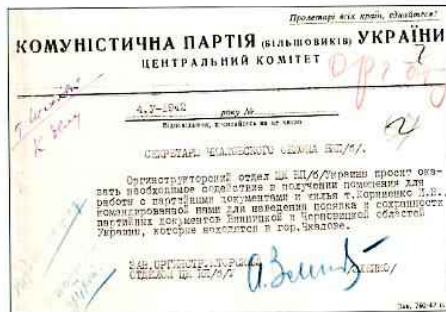
Письмо зав. орготделом ЦК КП(б)У А. Эленко в Чкаловский обком ВКП(б) об оказании содействия архивисту І.В. Корніщенко в работе с архивами Украины, 4 мая 1942 г. ЦДНИОО, ф. 371, оп. 6, д. 41, л. 5