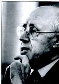
Ростропович М.А., музыкант, виолончелист, почетный гражданин г. Оренбурга