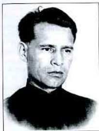
Денисов Г.А., первый секретарь Чкаловского обкома ВКП(б) (1942–1948) ЦДНИОО, ф. 371, оп. 26, д. 3043, л. 3