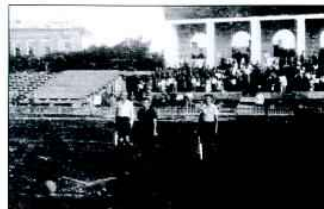
Перед началом дружеского матча по футболу между командами чехословацкого военного батальона и чкаловского «Динамо», г. Чкалов, 19 июля 1942 г. Брож М. Военные документы рассказывают. – Прага, 2007

Распоряжение Совета народных комиссаров СССР № 11 323-рс от 3 октября 1941 г. об отводе лесосечного фонда под строительство зимних барачек для польской армии ГАОО, ф. р-1014, от. 22, д. 98, л. 231