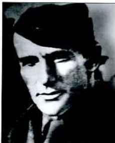
Ярош О., офицер чехословацкой армии, Герой Советского Союза (1943). 1942 г. Филиал ГАОО в г. Бузулуке, ф. р-1, оп. 1, П-195