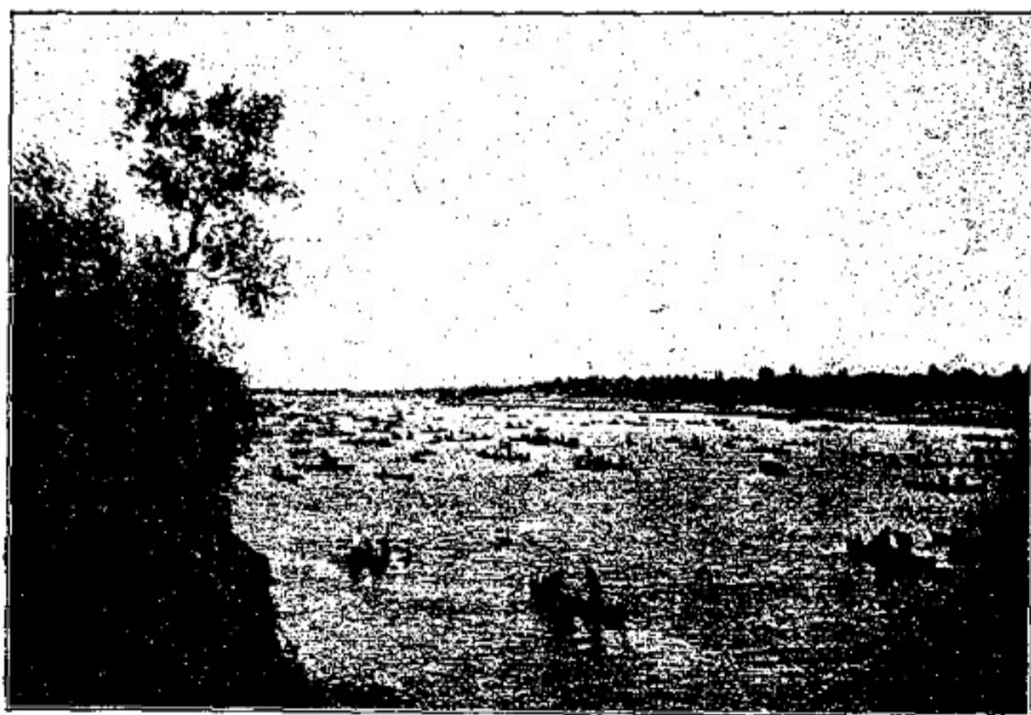
Осенняя паводья на р. Уралѣ.