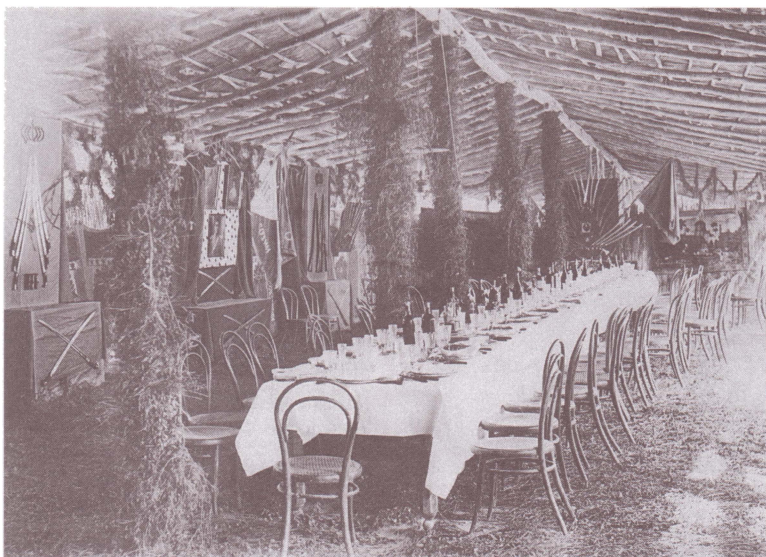
Офицерская столовая 5-го Оренбургского казачьего полка в день полкового праздника. Конец XIX в. Оренбургский областной краеведческий музей.