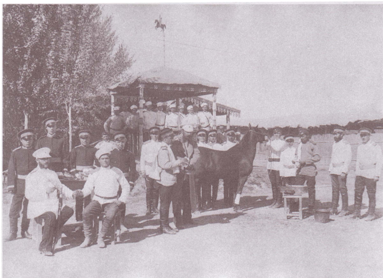
Ветеринарный врач 5-го Оренбургского казачьего полка на практике. Конец XIX в. Оренбургский областной краеведческий музей. Публикуется впервые