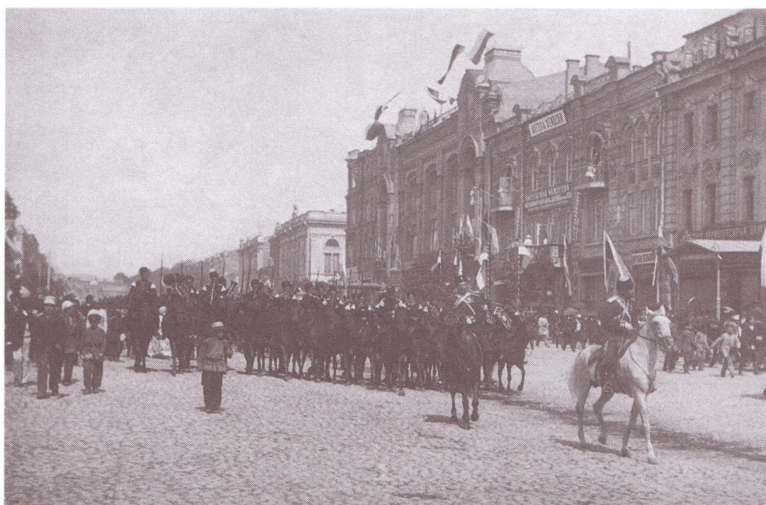
Оренбургские казаки на Крещатике. Киев. 1888 г. Публикуется впервые