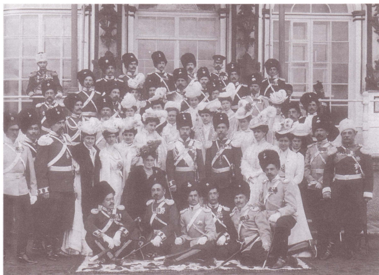
Император Николай II, императрица Александра Федоровна на празднике Лейб-гвардии Сводно-казачьего полка. 6 апреля 1907 г. ( Часовые отечества ). Из истории российского казачества. Каталог выставки. СПб., 2006)