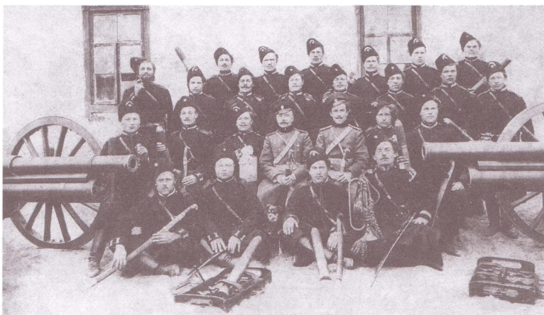
1-я Оренбургская казачья батарея. Конец XIX в.