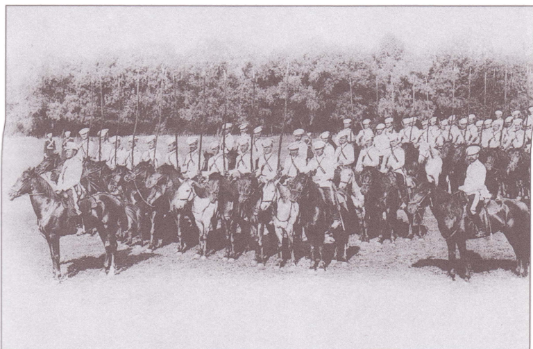
1-й Оренбургский казачий полк. Открытка. Конец XIX в.