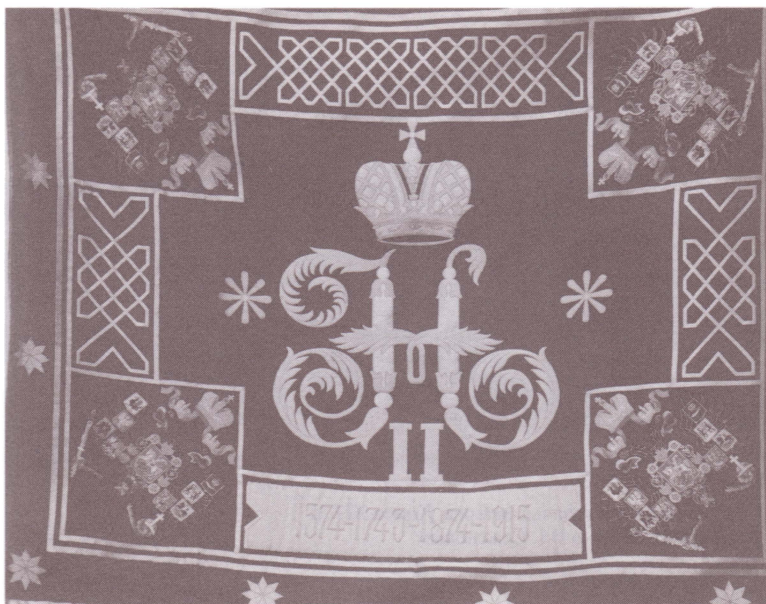
Знамя 2-го Оренбургского казачьего полка.

Военно-исторический музей артиллерии, инженерных войск и войск связи.