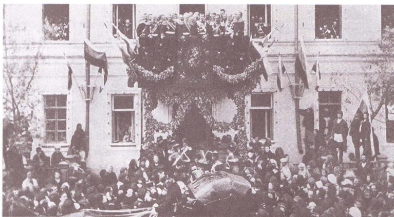
Приезд Наследника цесаревича Николая Александровича в Оренбург. Возле здания Войскового хозяйственного правления на Неплюевской улице. 1891 г.