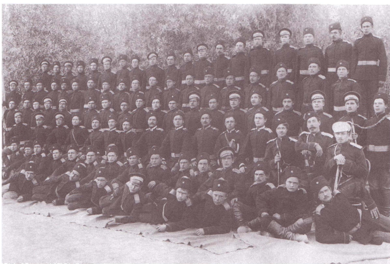
4-я сотня 5-го Оренбургского казачьего полка. Ташкент. Конец XIX в. Оренбургский областной краеведческий музей