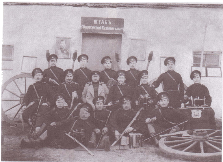
Чины штаба 3-й Оренбургской казачьей батареи. 14 ноября 1898 г. Публикуется впервые