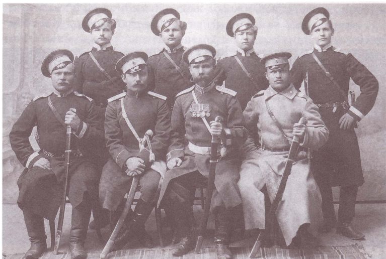
Казаки 3-го военного отдела Оренбургского казачьего войска. Троицкий краеведческий музей.