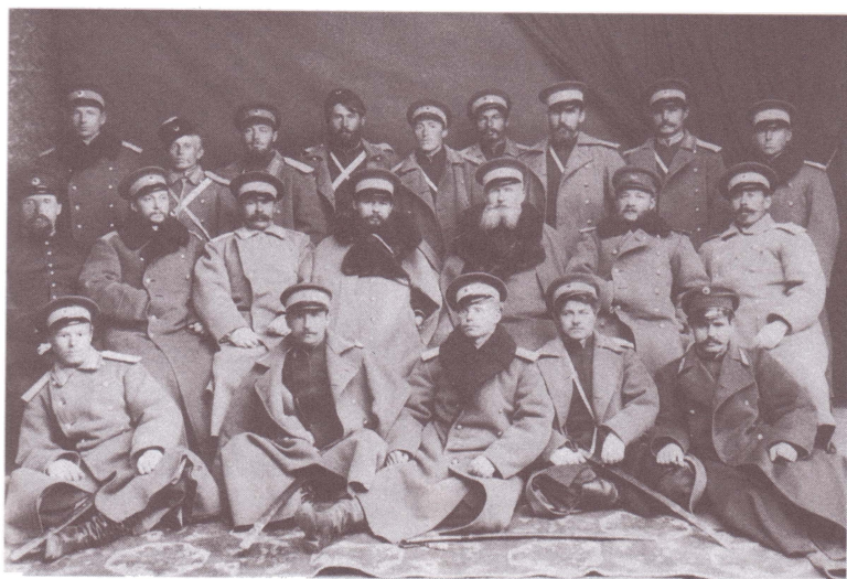
Группа офицеров одного из Оренбургских казачьих полков. Конец XIX в.