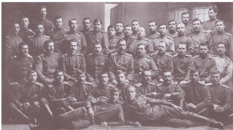
Офицеры и казаки 3-го Оренбургского казачьего полка. Троицк, 1903 г.