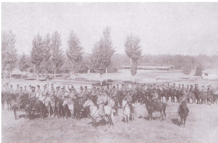
1-я сотня 5-го Оренбургского казачьего полка. Конец XIX в. Оренбургский областной краеведческий музей. Публикуется впервые