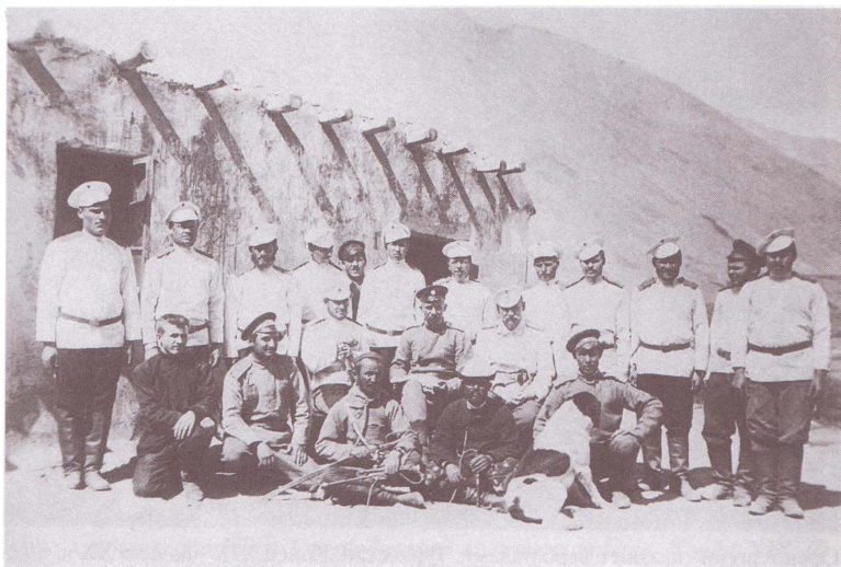
Оренбуржцы на Памире.