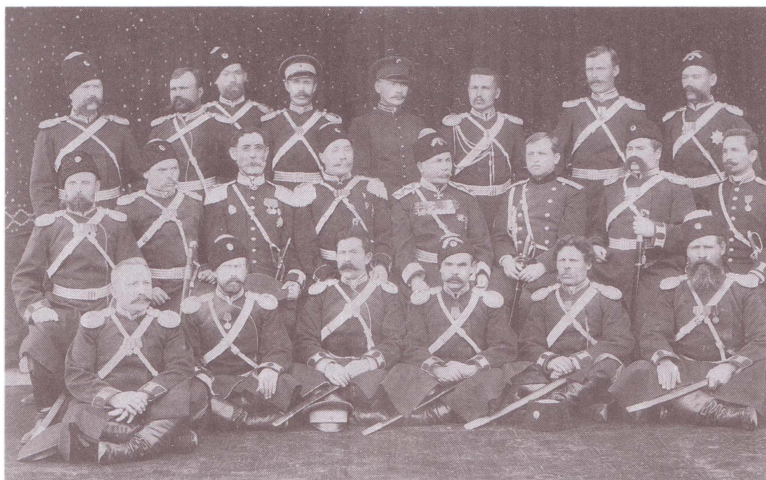
Группа старших офицеров Оренбургского казачьего войска. Конец XIX в.