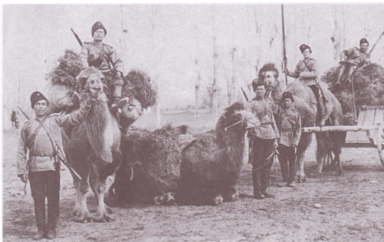
Оренбургские казаки с верблюдами. Туркестан. Конец XIX—начало XX в.