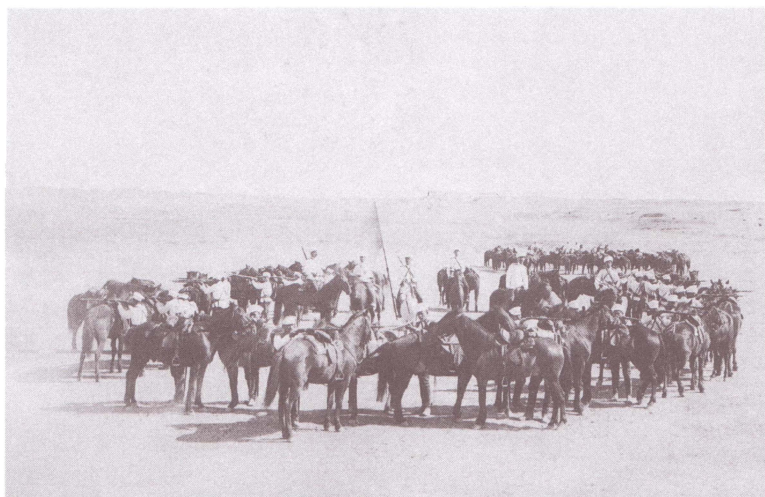
4-я сотня 5-го Оренбургского казачьего полка. Конец XIX в. Оренбургский областной краеведческий музей. Публикуется впервые