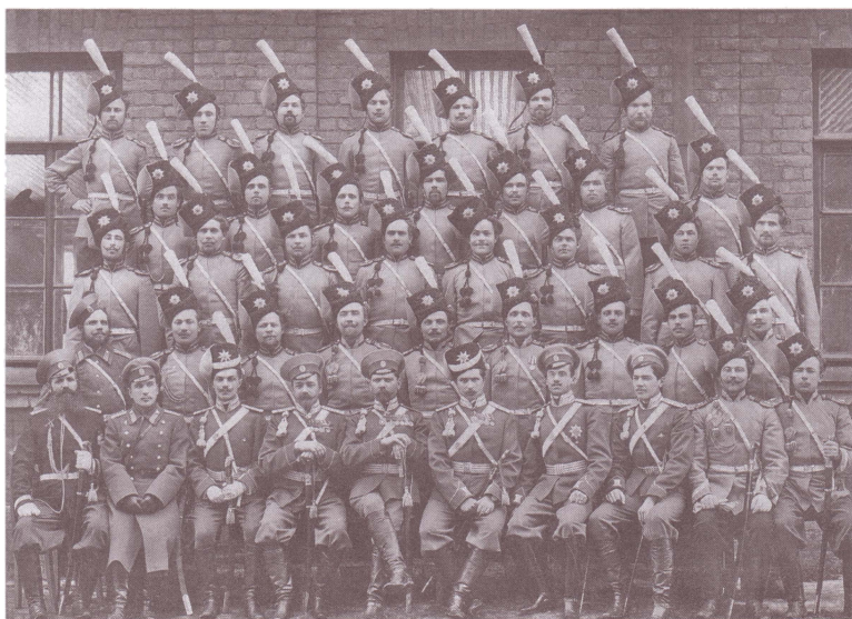
Чины 2-й (оренбургской) сотни Лейб-гвардии Сводно-казачьего полка в парадной форме.