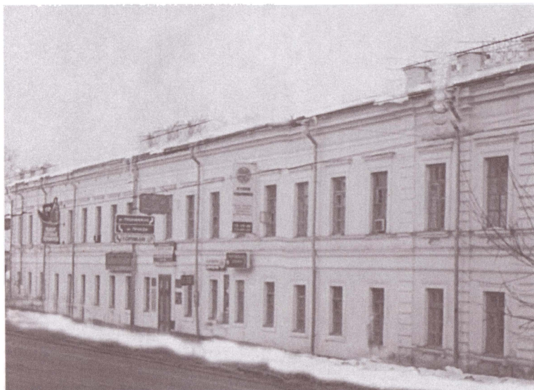
Войсковое хозяйственное правление Оренбургского казачьего войска. Оренбург.