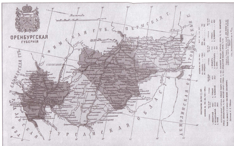
Карта Оренбургской губернии. Начало XX в. Открытка.