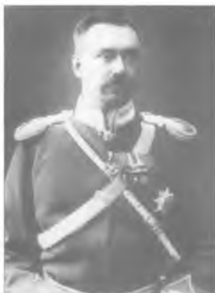
Неизвестный обер-офицер Оренбургского казачьего войска