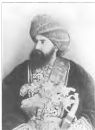
Эмир Бухарский Сейид Абд ал-Ахад Бахадур-хан. 1893 г.