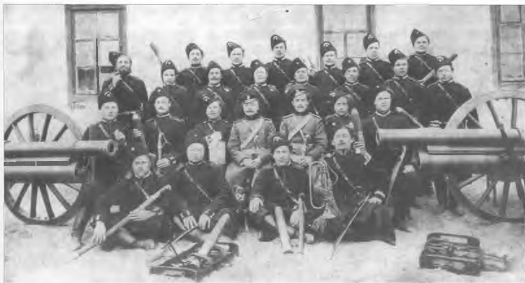
Группа офицеров и казаков 1-й Оренбургской казачьей батареи