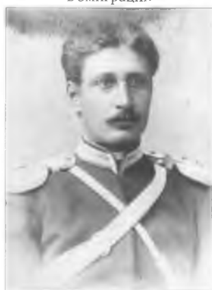
Лебедкин Н.М. 1894 г.