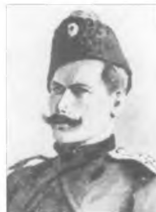
Исаенко Н.Р. в период русско-японской войны