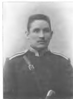
Неизвестный юнкер Оренбургского казачьего юнкерского училища. Начало XX в.