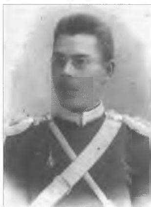
Неизвестный обер-офицер Оренбургского казачьего войска