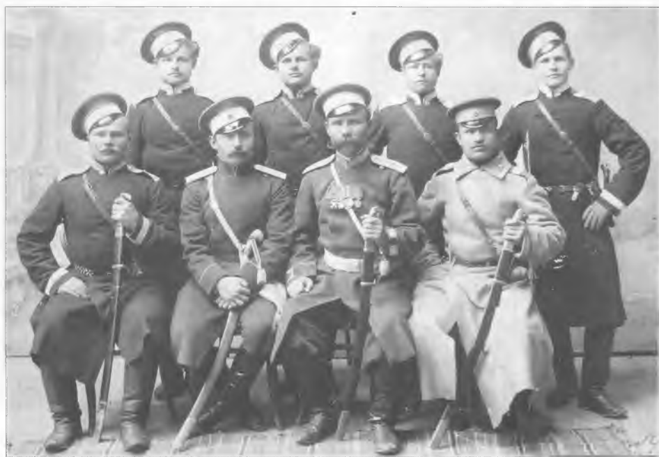
Группа офицеров и казаков 3-го военного отдела Оренбургского казачьего войска. Начало XX в.