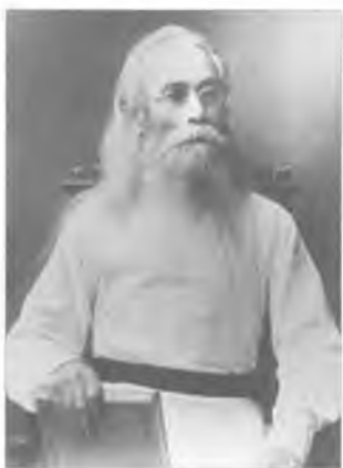
Преподобный старец Варсонофий (Плекханков П.И.)