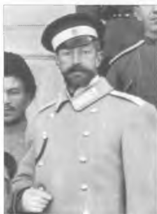
Неизвестный офицер Оренбургского казачьего училища