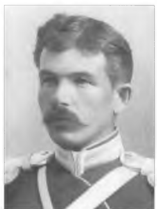
Мякутин А.В. 1895 г.