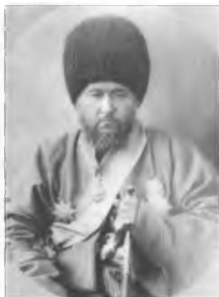
Хан Хивинский Мухаммед Рахим Хан