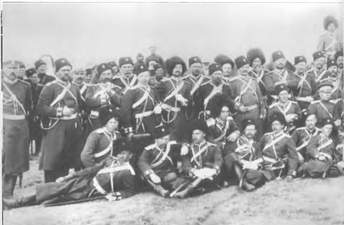
Группа офицеров 9-го и 10-го Оренбургских казачьих полков перед отправкой на русско-японскую войну. 1904 г.