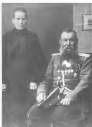
Неизвестный офицер 1-го военного отдела Оренбургского казачьего войска с супругой