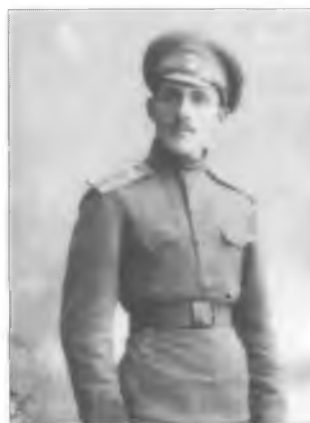
Неизвестный юнкер Оренбургского казачьего юнкерского училища