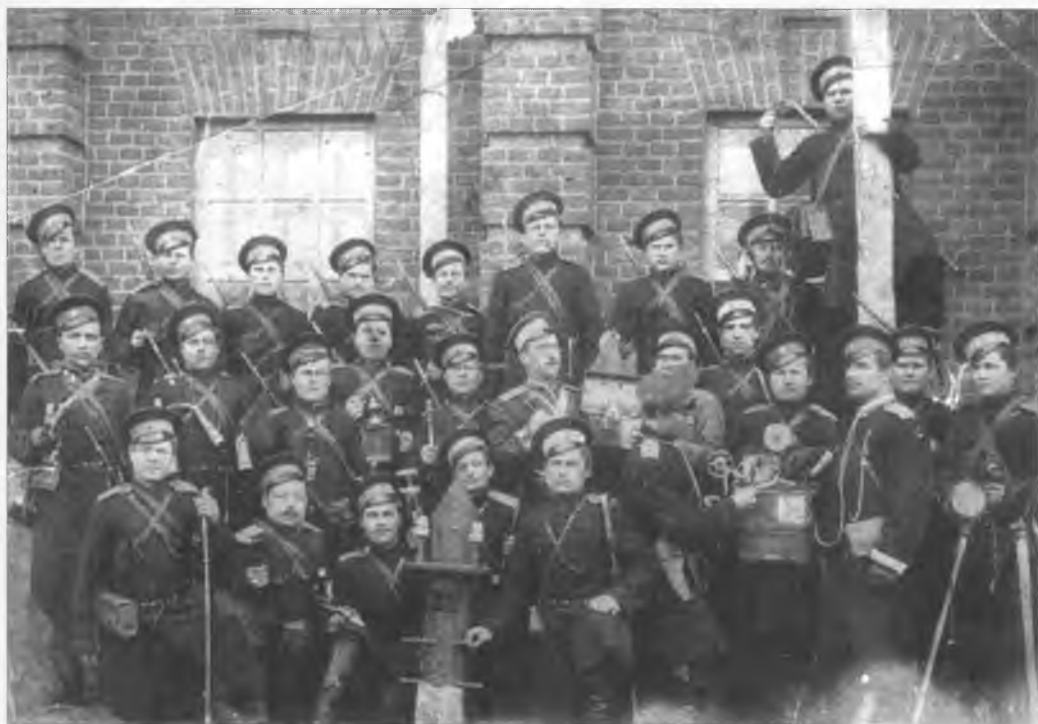
Команда связи одного из Оренбургских казачьих полков. Офицер в центре