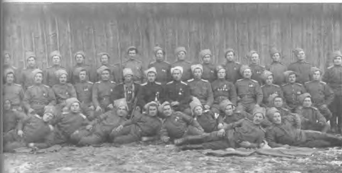
Офицеры и казаки 1-го Оренбургского казачьего полка. Первая мировая война