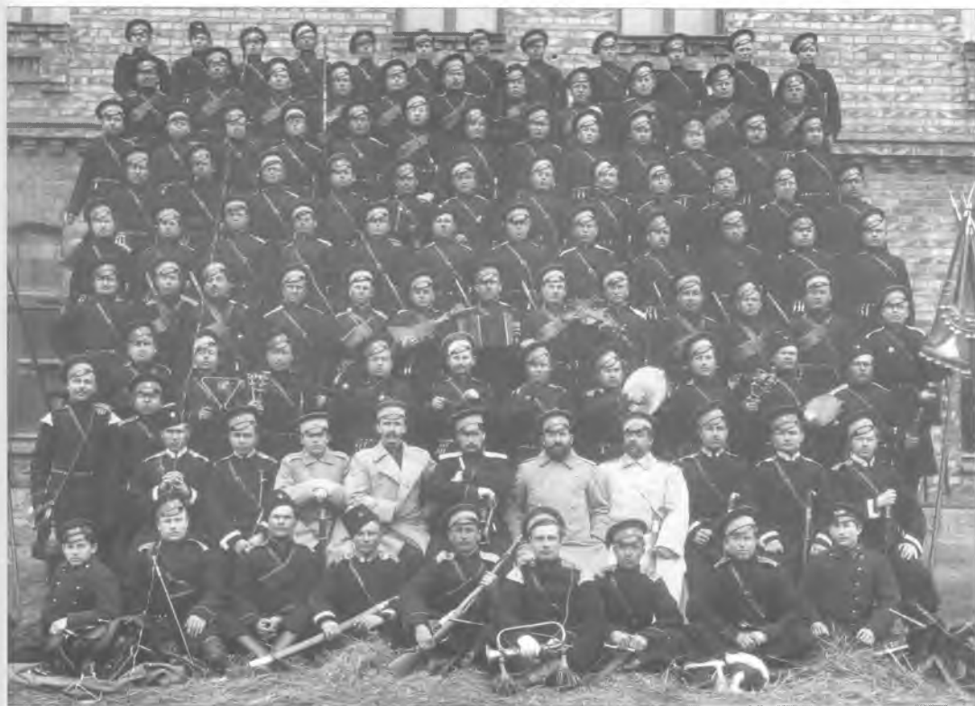
Группа офицеров и нижних чинов 2-й сотни 2-го Оренбургского казачьего полка. Начало XX в.