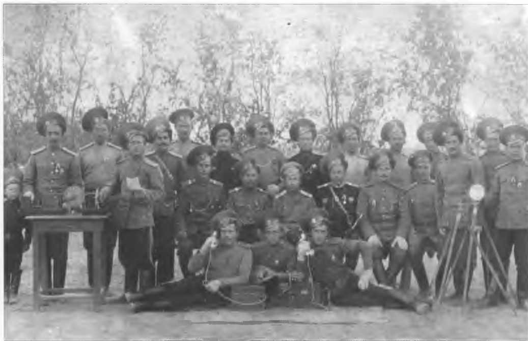
Казачи команды связи, в центре офицер. 1913–1914 гг.