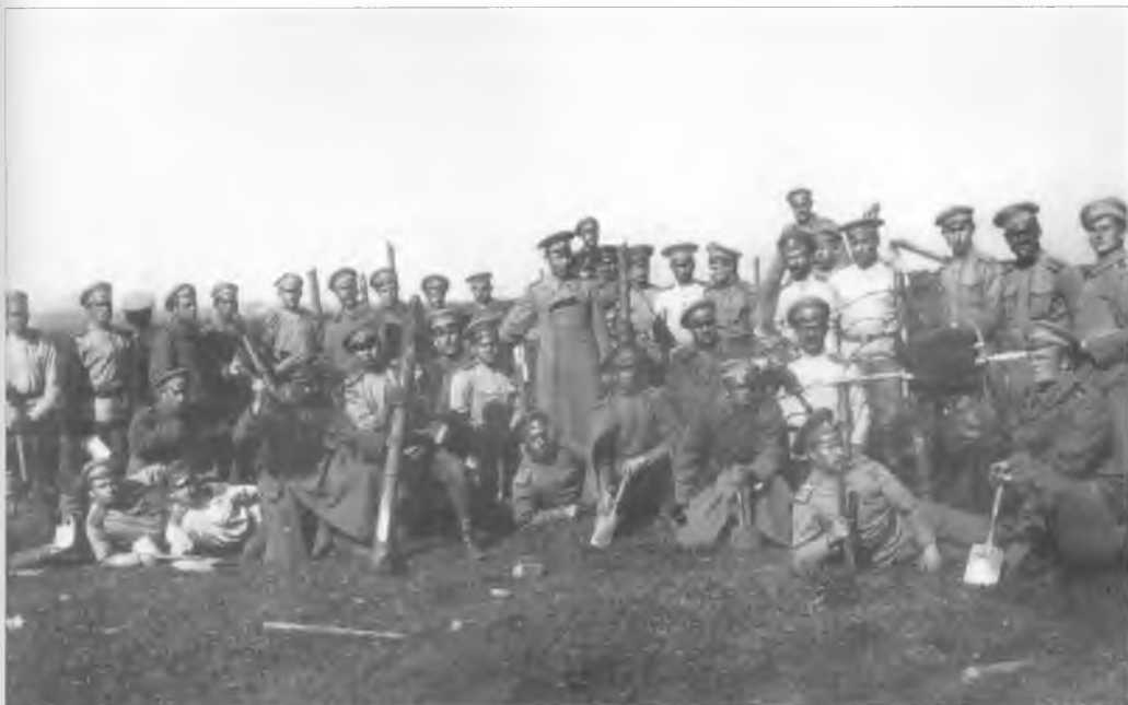
Группа юнкеров Оренбургского казачьего училища. 1914–1917 гг.