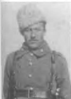
Корольков И.Г. Деревня Свиняры. 19 февраля 1915 г.