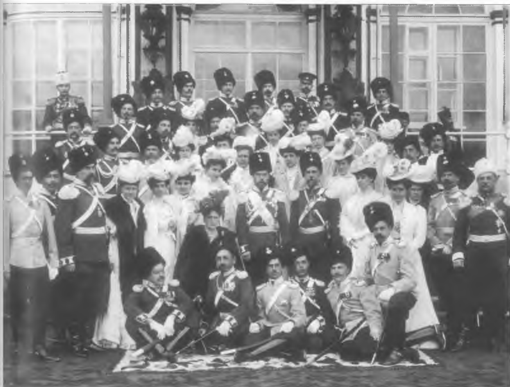
Император Николай II, императрица Александра Федоровна на празднике Лейб-гвардии Сводно-казачьего полка. 6 апреля 1907 г.