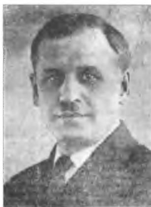
Мыслиин А.М. в эмиграции