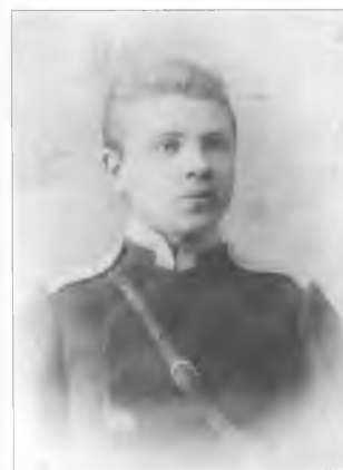
Неизвестный юнкер Оренбургского казачьего юнкерского училища