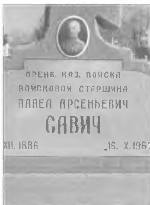
Могила П.А. Савича