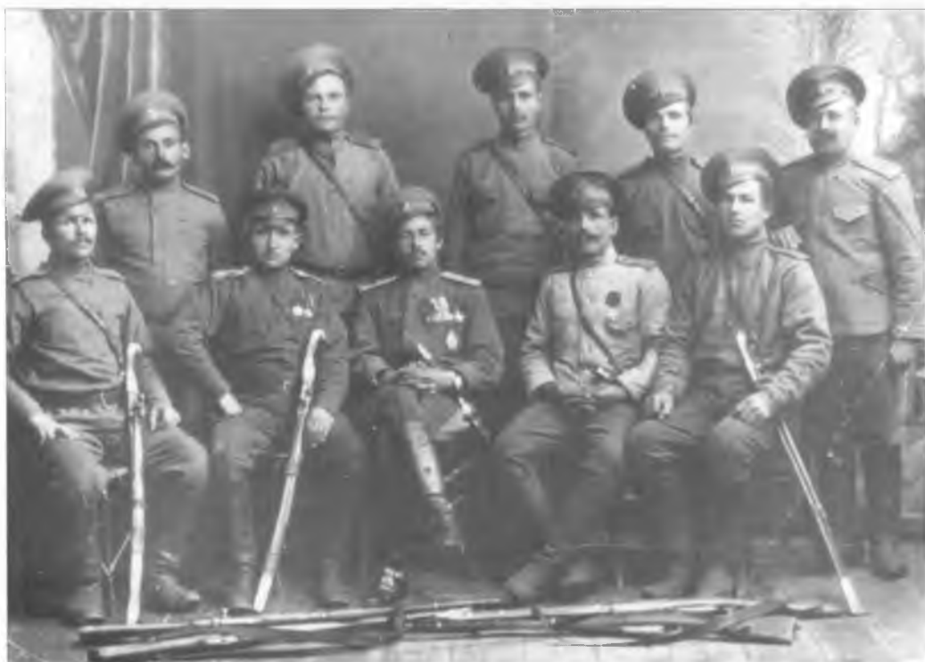
Группа офицеров и казаков 13-го Оренбургского казачьего полка