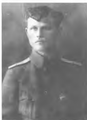
Неизвестный обер-офицер Уральского казачьего войска