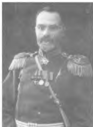
Неизвестный войсковой старшина 6-го Оренбургского казачьего полка. Начало XX в.