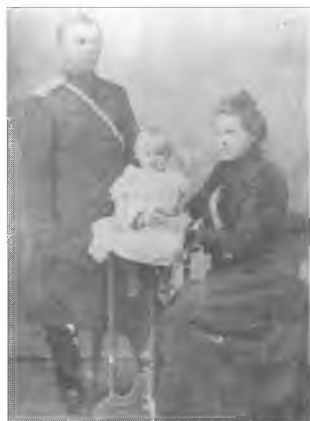
Неизвестный офицер Оренбургского казачьего войска с семьей