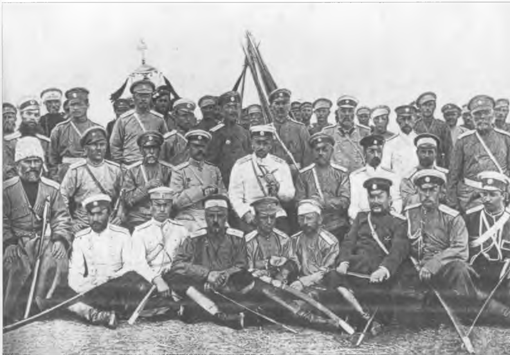
Великий князь Борис Владимирович и два оренбургских офицера (в светлых фуражках) в 4-м Сибирском казачьем полку. Русско-японская война. 1904 г.