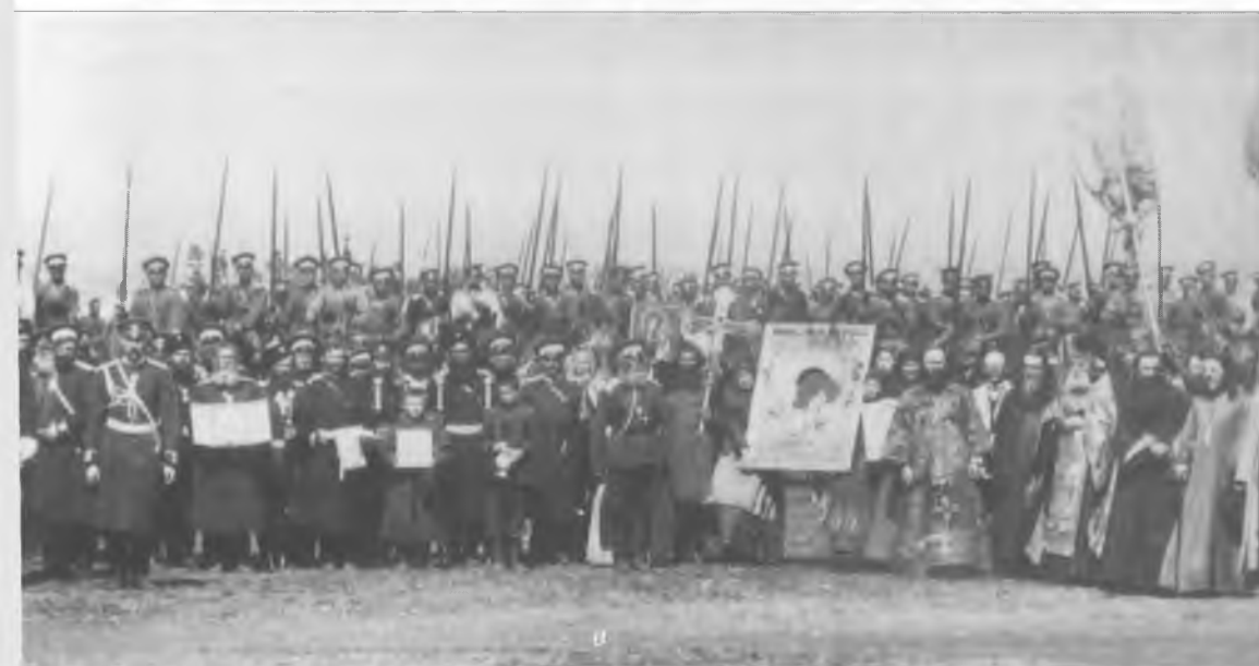
Торжественные проводы 9-го и 10-го Оренбургских казачьих полков на русско-японскую войну. Верхнеуральск. 1904 г.