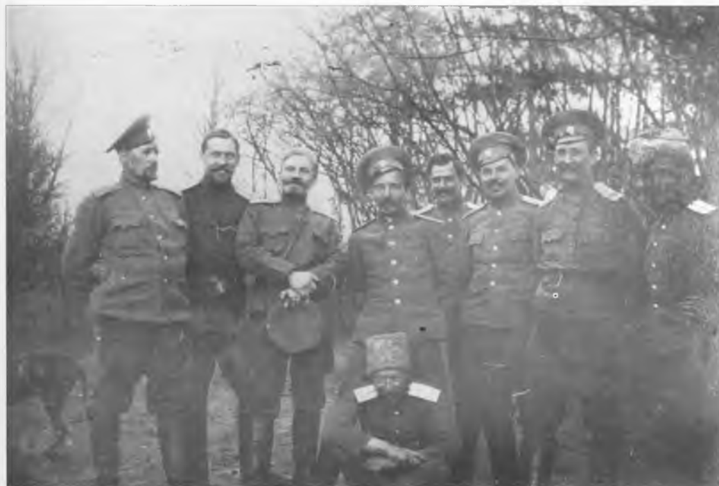
Офицеры 2-го Оренбургского казачьего полка на прогулке после обеда. Деревня Халудза. 10 апреля 1915 г.