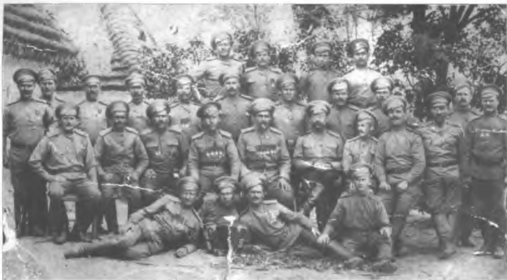
Казачи и офицери Оренбургского казачьего войска. 1914–1916 гг.