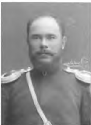
Кременцов П.И. 1889 г.