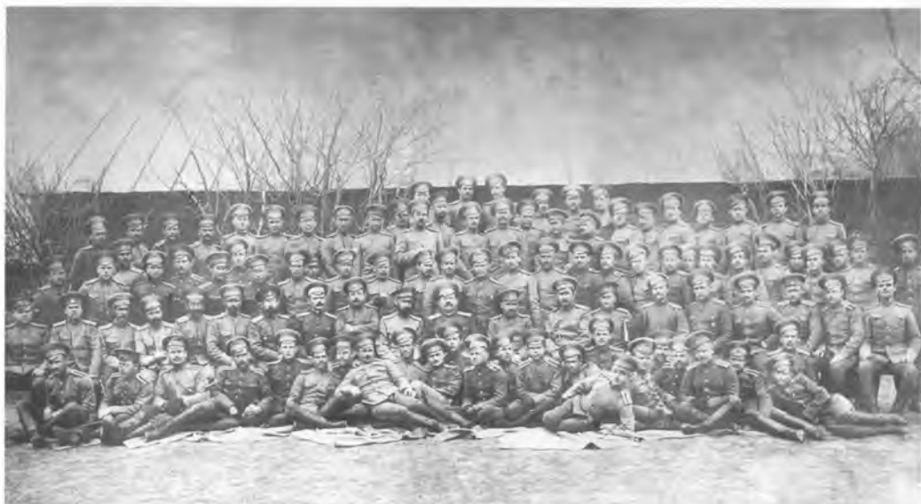
Офицеры и юнкера Оренбургского казачьего училища. 1912–1916 гг.