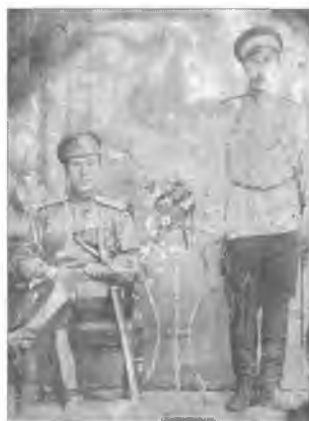
Неизвестный офицер Оренбургского казачьего войска (слева). Харбин