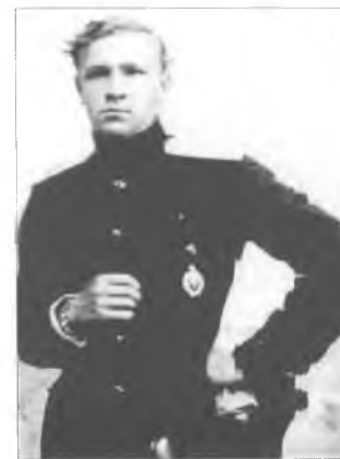
Неизвестный офицер Оренбургского казачьего войска. Фото периода Гражданской войны