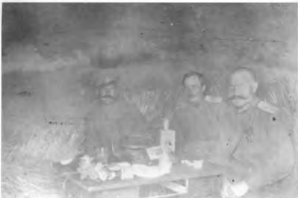
Офицеры 2-го Оренбургского казачьего полка в землянке за чаем у деревни Кремна Гурны