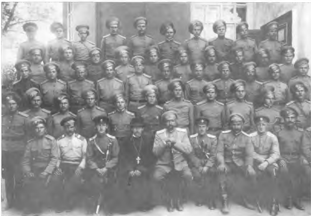
Группа офицеров и казаков 1, 3 и 5-го Оренбургских казачьих полков. Первая мировая война