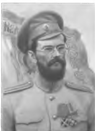
Кретчмер В.Ф. Картина худ. Е. Демакова по фото 1916 г.