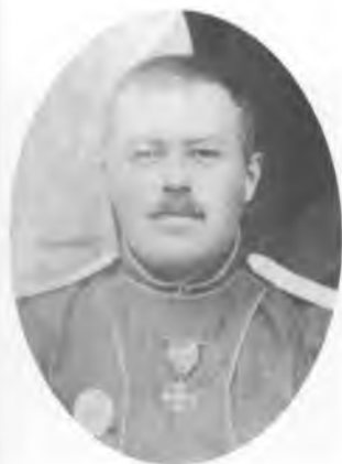
Дутов А.И. Не ранее 1919 г.