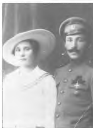
Неизвестный офицер с супругой