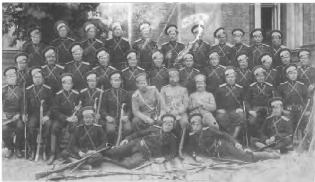
Офицеры и казаки 1-го Оренбургского казачьего полка. Начало XX в.