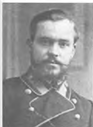
Каргин К.Л. 1911 г.