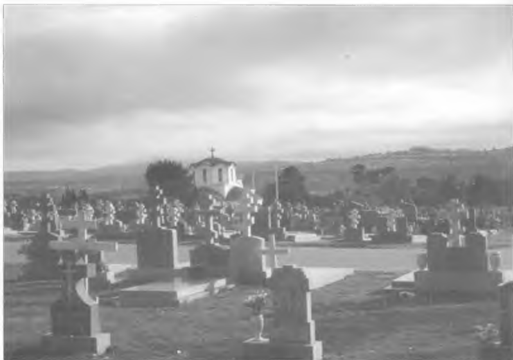
Сербское кладбище в Сан-Франциско