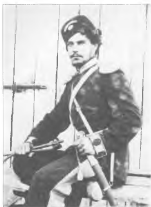
Неизвестный хорунжий Оренбургского казачьего войска. Около 1890 г.