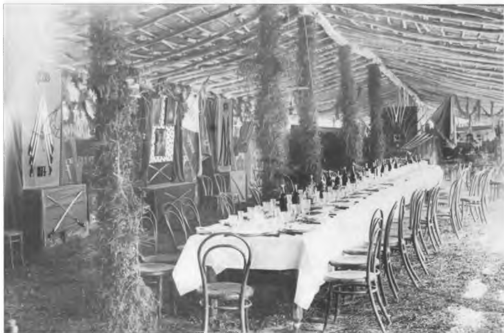
Офицерская столовая 5-го Оренбургского казачьего полка в день полкового праздника 30 августа. Конец XIX в.