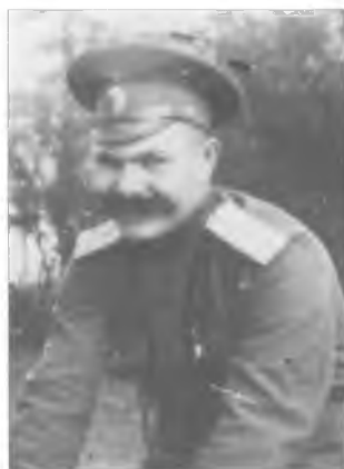
Полозов С.С. Деревня Халудза. 1915 г.