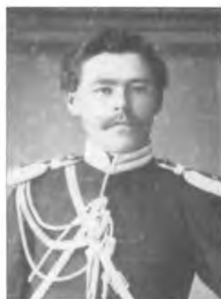
Дюскин К.И. 1890 г.