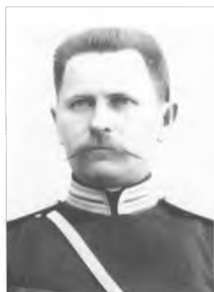
Неизвестный офицер Оренбургского казачьего войска