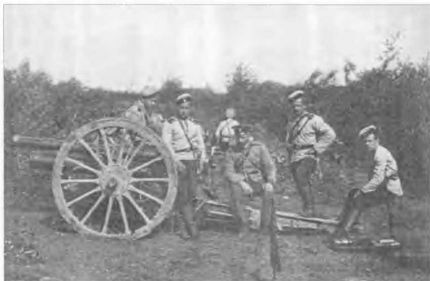
Юнкера Михайловского артиллерийского училища на маневрах. Начало XX в.