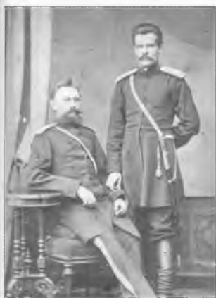
Офицеры 2-го Оренбургского казачьего полка. Нижний Новгород. Конец XIX в.