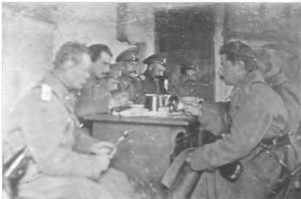
Офицеры 2-го Оренбургского казачьего полка за столом. 1915 г.