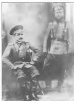
Неизвестные офицеры Оренбургского казачьего войска. Слева офицер из станции Изобильной