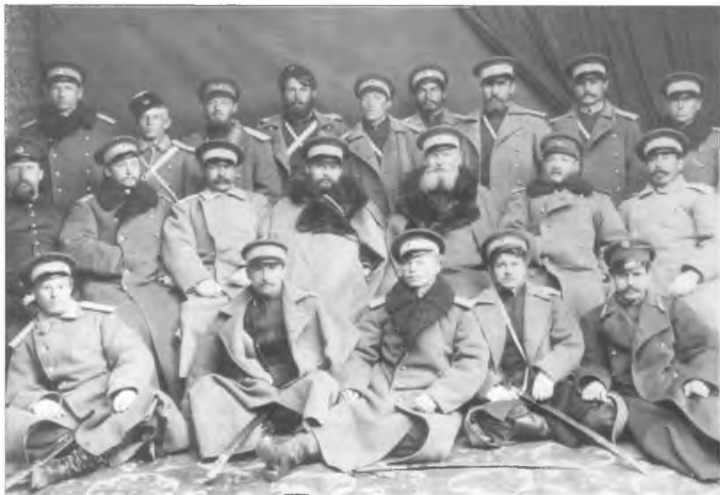
Офицеры одного из Оренбургских казачьих полков (возможно, 5-й Оренбургский казачий полк). Конец XIX в.