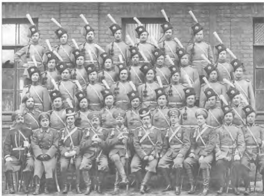
Чины 2-й (Оренбургской) сотни Лейб-гвардии Сводно-казачьего полка. Начало XX в.