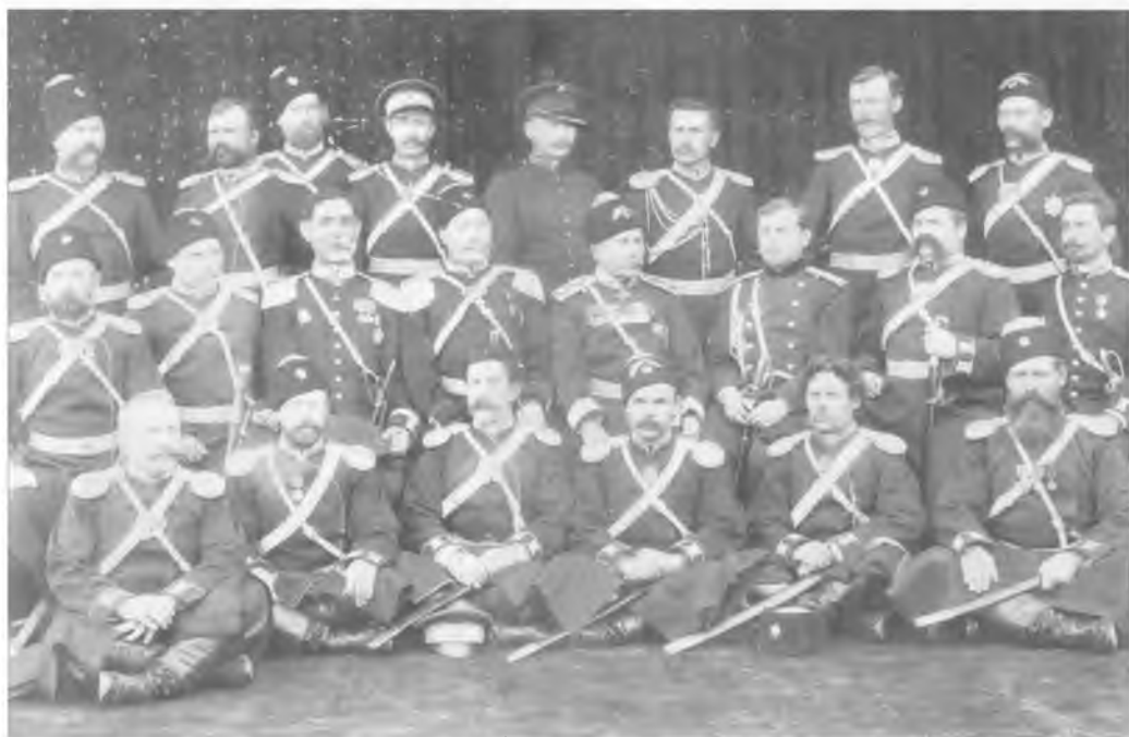
Группа оренбургских офицеров и генерал в Туркестане. Начало XX в.