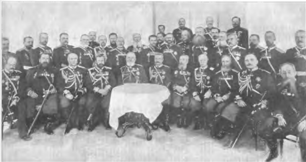
Празднование 25-летия покорения Хивы. Главные участники Хивинского похода. 1873 г.