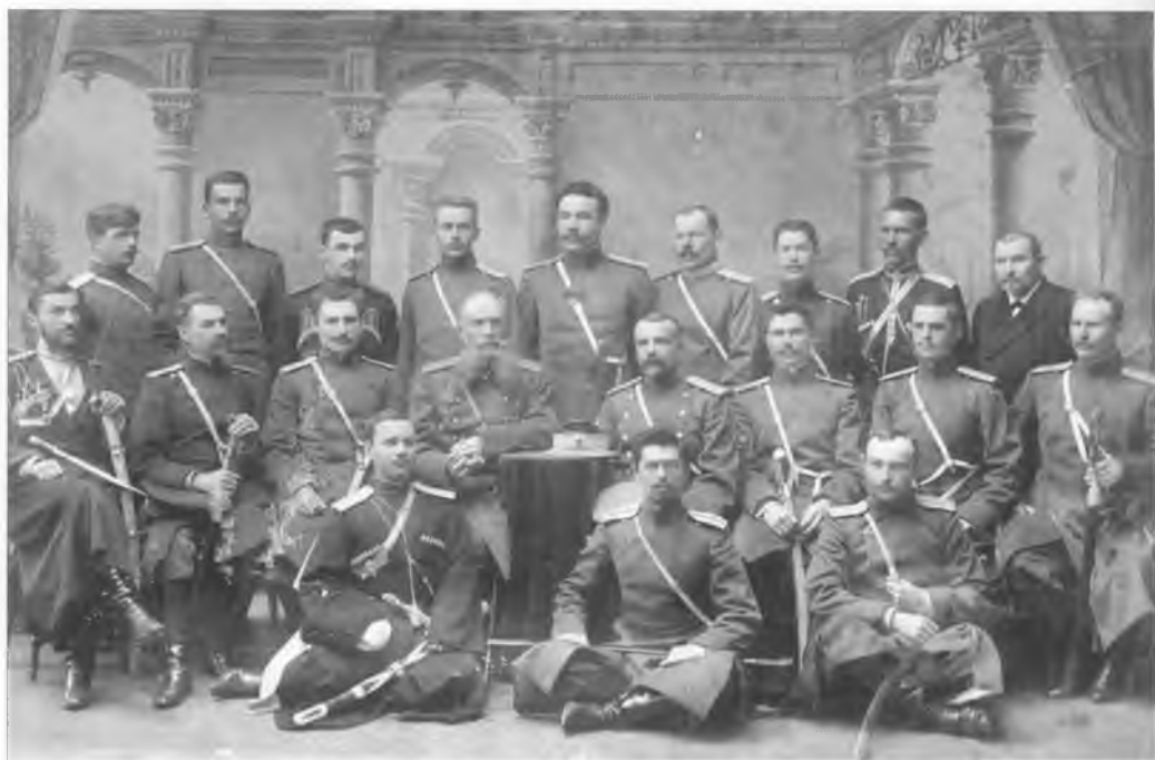
Казачьи офицеры в Офицерской стрелковой школе