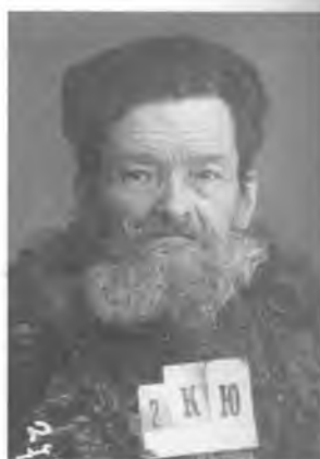
Кретчмер В.Ф. Тюремное фото. 1933 г.