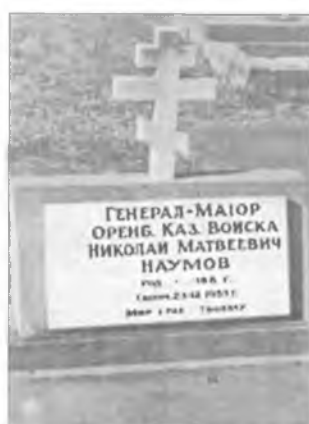
Могила Наумова Н.М. на кладбище в Сиднее