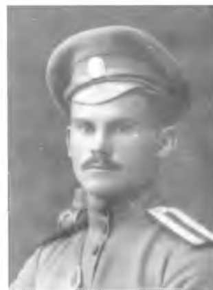
Неизвестный юнкер Оренбургского казачьего училища. Первая мировая война