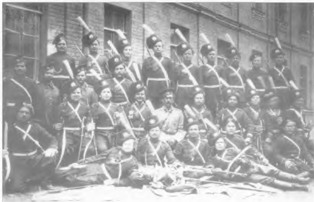
Офицер и казаки 2-й (Оренбургской) сотни Лейб-гвардии Сводно-казачьего полка