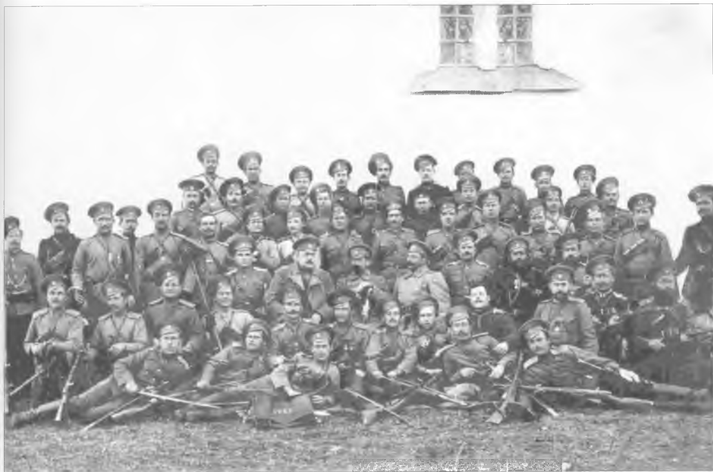
Офицеры и казаки 1-й Оренбургской казачьей сотни. Первая мировая война