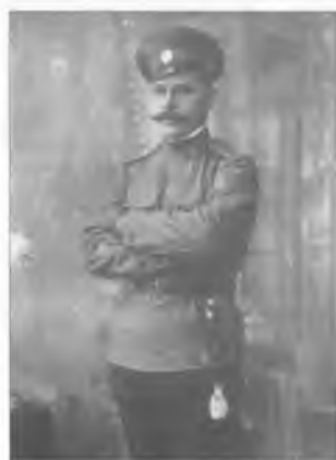
Неизвестный сотник Оренбургского казачьего войска. 26 апреля 1915 г.