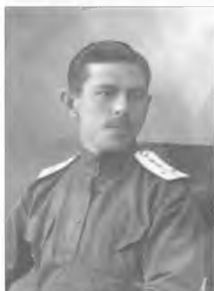
Неизвестный подесаул Оренбургского казачьего войска