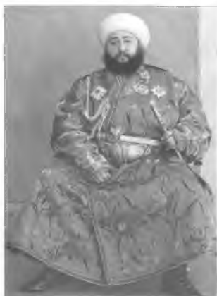
Эмир Бухарский Сеид Алим. 1911 г.