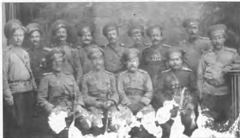
Офицеры 5-го Оренбургского казачьего полка