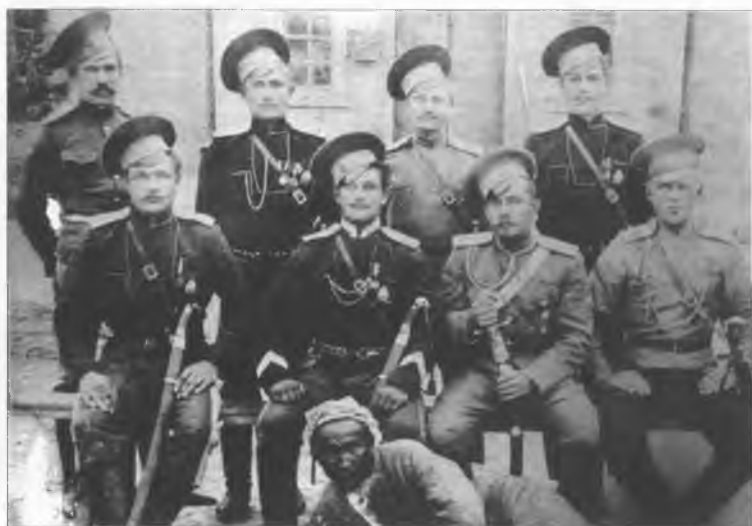
Офицеры и казаки в Туркестане. Начало XX в.