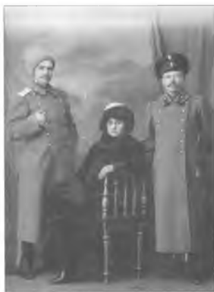
Неизвестный сотник Оренбургского казачьего войска (слева). Начало XX в.