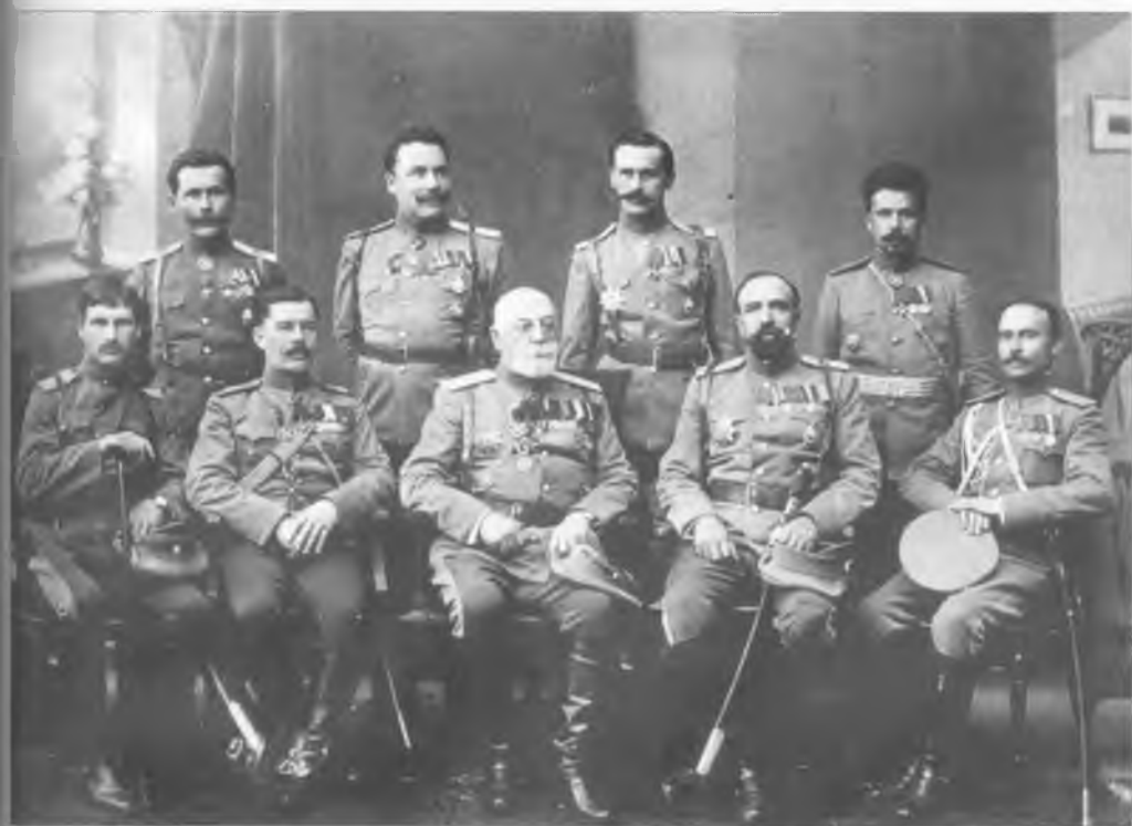
Офицеры Войскового штаба Оренбургского казачьего войска. В центре генерал-лейтенант Н.А. Сухомлинов, второй слева в верхнем ряду есаул П.М. Горшков. 1914 г.