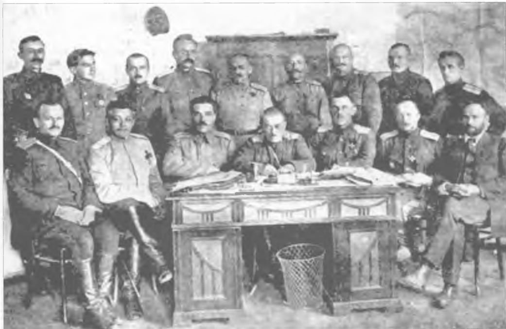
Чрезвычайная конференция представителей девяти казачьих войск Востока России. В центре сидит почетный председатель А.И. Дутов, стоит третий справа М.П. Шмотин. Омск. Август 1919 г.