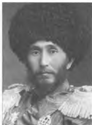
Хан Хивинский Сеид Асфендиор Бохадур