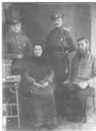
Неизвестные офицеры Оренбургского казачьего войска