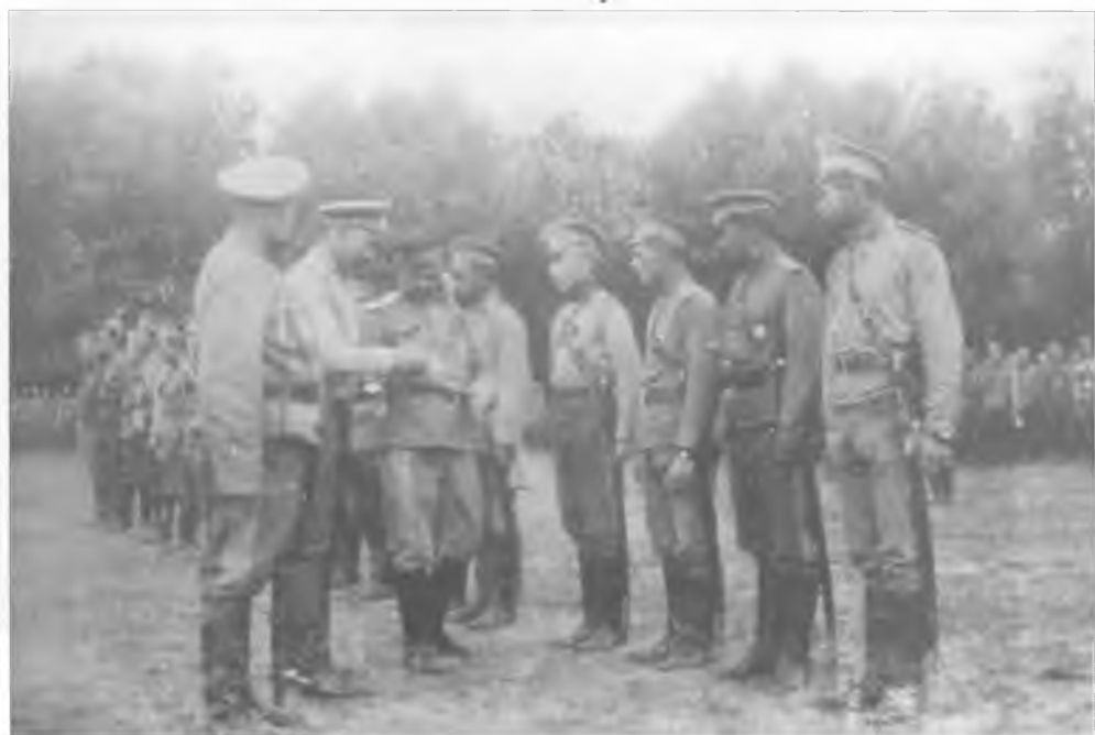
Во 2-м Оренбургском казачьем полку. 1 июля 1915 г.