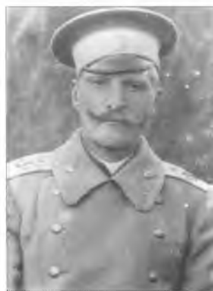
Неизвестный войсковой старшина 3-го Оренбургского казачьего полка. 1912–1913 гг.