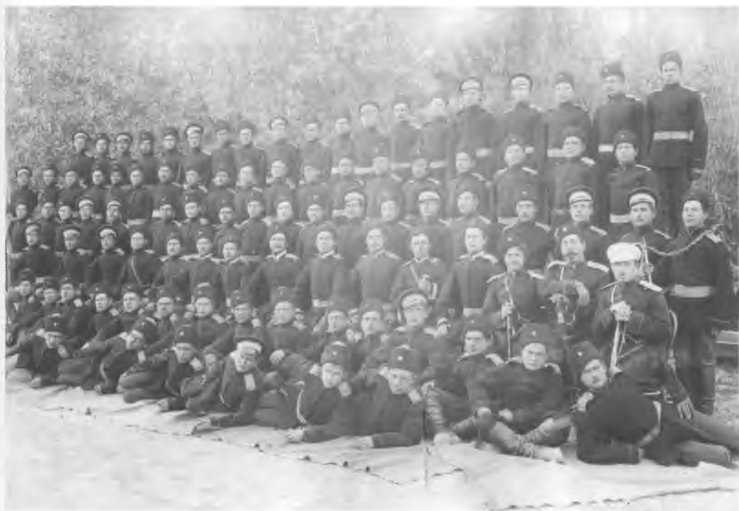
Четвертая сотня 5-го Оренбургского казачьего полка. Ташкент. Конец XIX в.