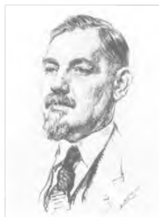
Махин Ф.Е. Рис. А.Л. Билица. 1930 г.