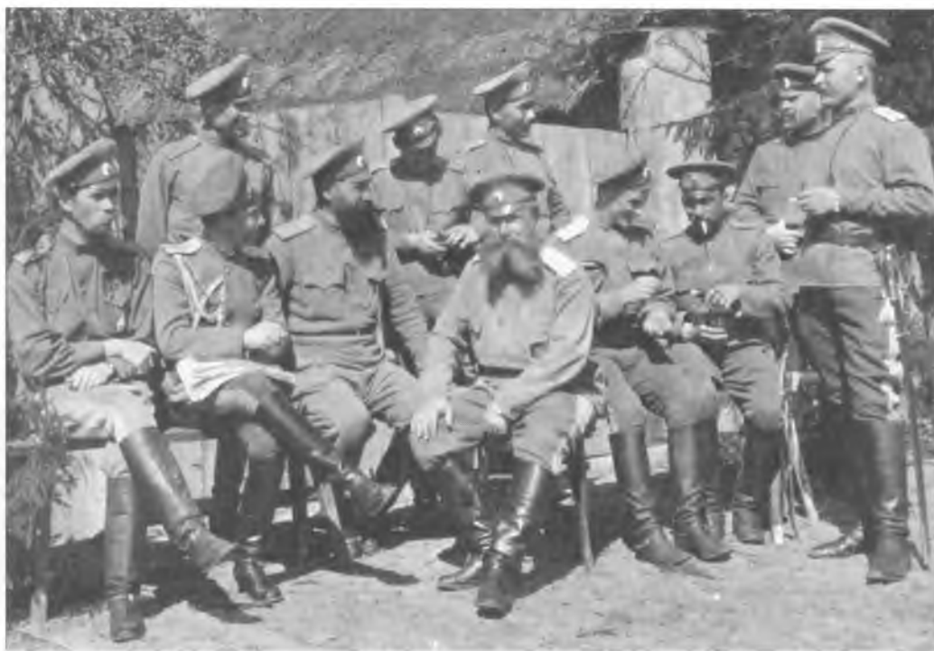
Группа офицеров 2-го Оренбургского казачьего полка. Иванисовка. 3 мая 1916 г.