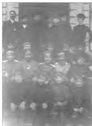
Неизвестный офицер Оренбургского казачьего войска с группой казаков и казачат