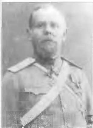
Неизвестный офицер 5-го Оренбургского казачьего полка с бухарским орденом