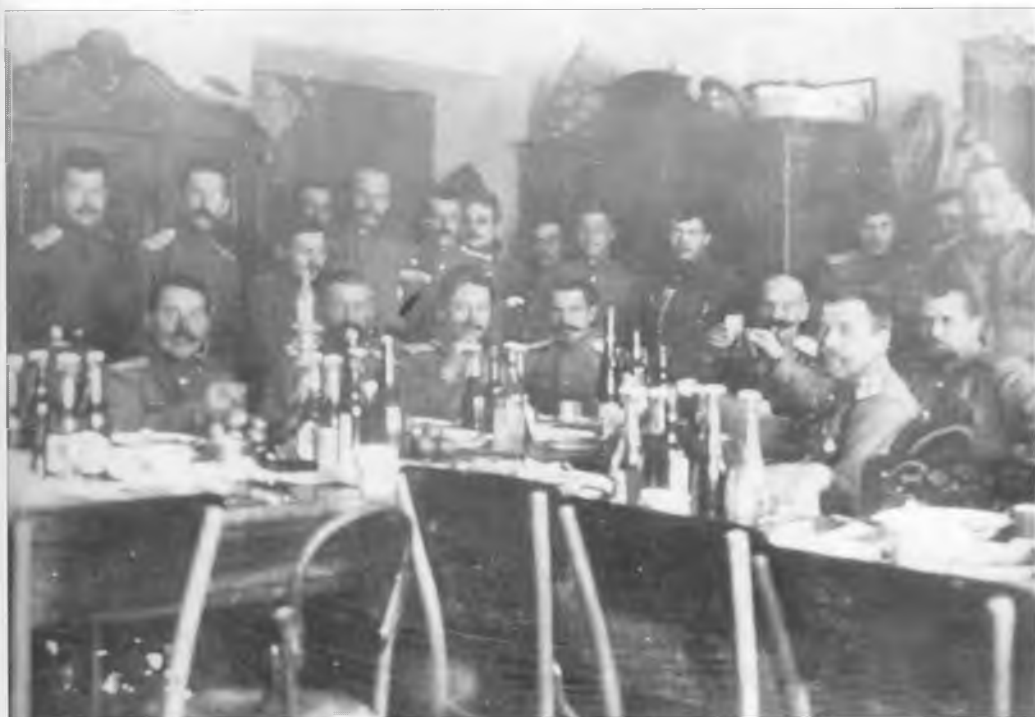
Офицеры 2-го Оренбургского казачьего полка. Разговение на Рождество. 1914 г.