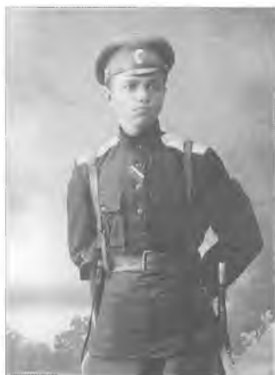
Неизвестный офицер Оренбургского казачьего войска с «Лентой Отличия». 1918–1919 гг.