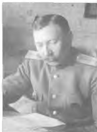
Неизвестный офицер Войскового хозяйственного правления с академическим знаком