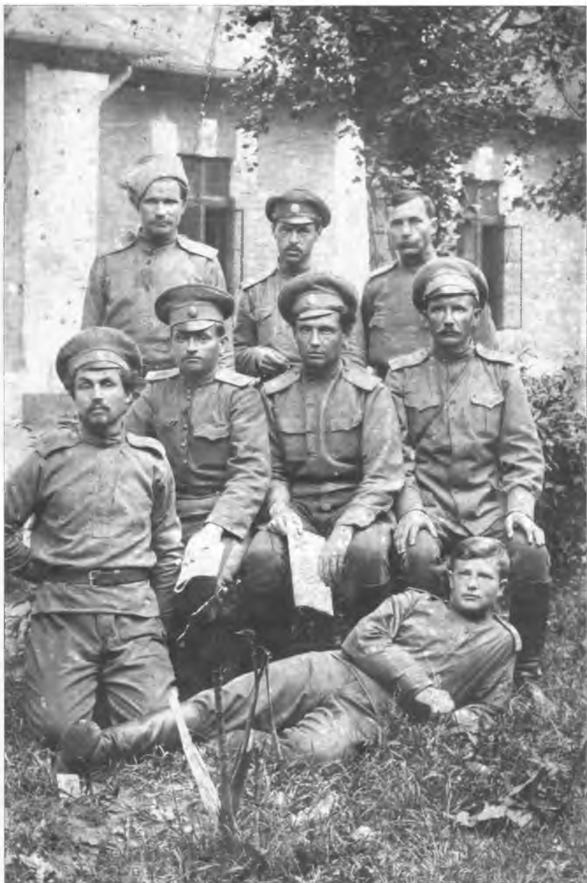
Группа неизвестных офицеров и унтер-офицеров 10-го Оренбургского казачьего полка. Первая мировая война