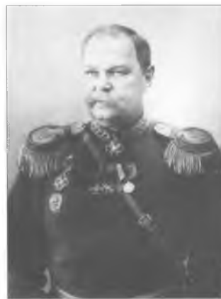
Полковник 2-го Оренбургского кадетского корпуса