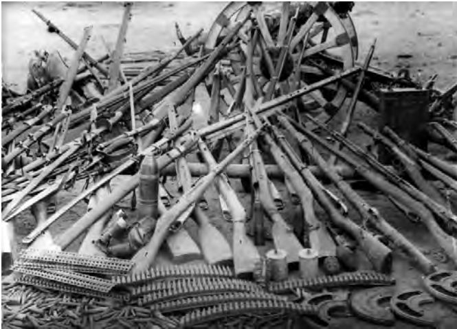
Оружие, захваченное при ликвидации отрядов Бакича