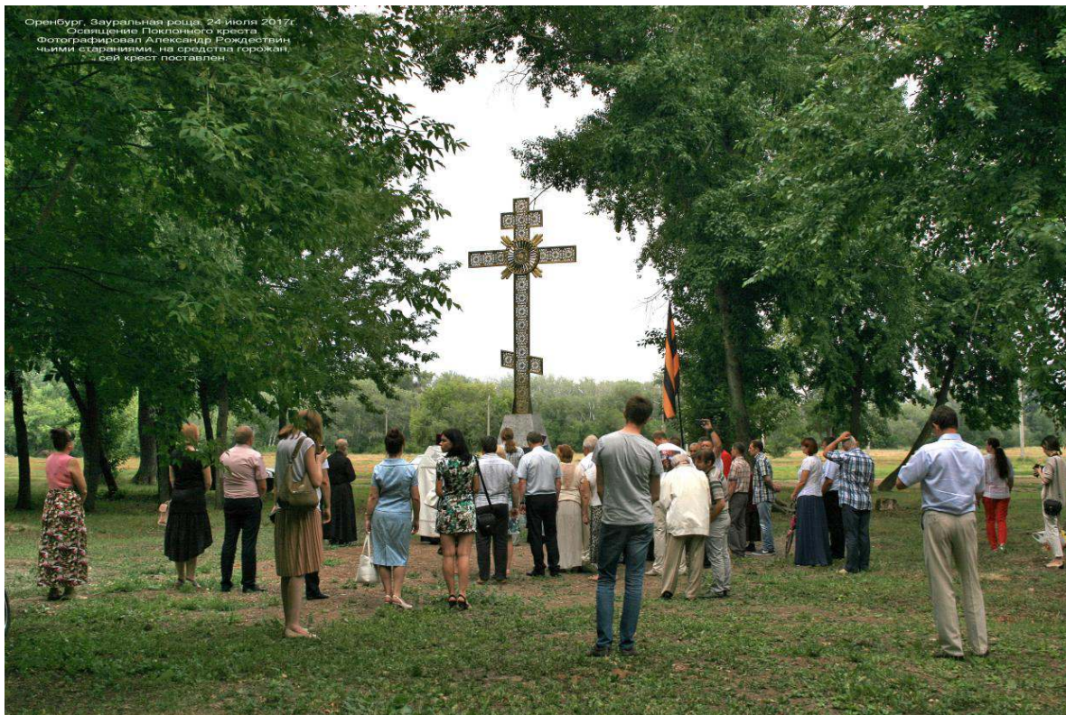
Освящение и открытие (24 июля 2017 г.) поклонного креста памяти разрушенной церкви великомученика и целителя Пантелеймона в Зауральной роще города Оренбурга.