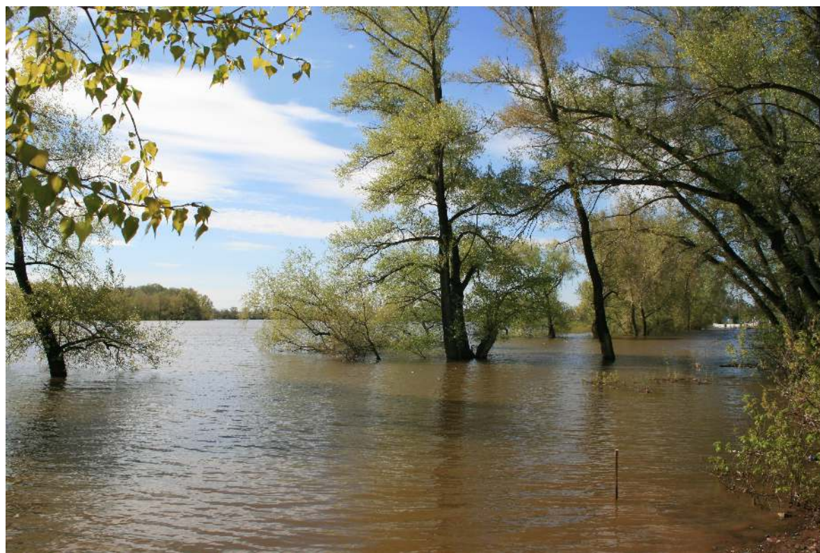
Оренбург. Зауральная роща. Большая вода. Май 2017 г.

По просьбе Оренбургского Движения Мемориал, согласно письма предоставленного Правительством Оренбургской области, в 2006 году, списочные материалы в объеме порядка 21000 (из более 26000) фамилий Оренбуржцев подвергшихся незаконным репрессиям и впоследствии реабилитированных переданы из архива УФСБ в музей истории города Оренбурга для составления печатных материалов и обеспечения открытого доступа граждан. Так же, музеем истории города Оренбурга, начиная с 1996 года Оренбургская общественность, передала иные имеющиеся материалы по теме репрессий, в том числе принятый и утвержденный в 2014 году эскизный проект обустройства Мемориала памяти жертв политических репрессий.