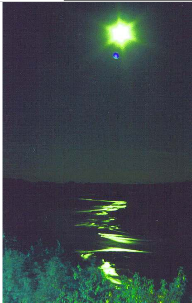
Город Оренбург, река Урал, речной поворот от старицы у роши, под Форштадтом.