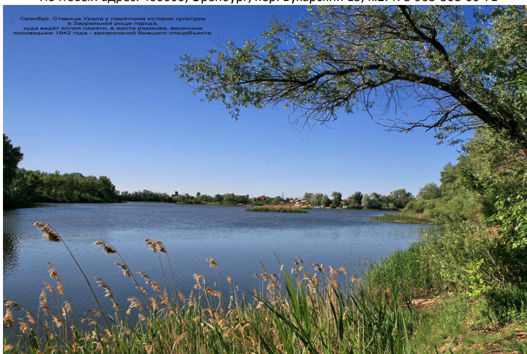
Оренбур. Старица Урала у памятника истории культуры в Зауральной роще города, куда ведет аллея памяти, в месте размыва, весенним половодьем 1942 года - захоронений бывшего спецобъекта.

Почтовый адрес: 460000, Оренбург, пер. Бухарский 15, к.2. т. 8-903-368-06-71