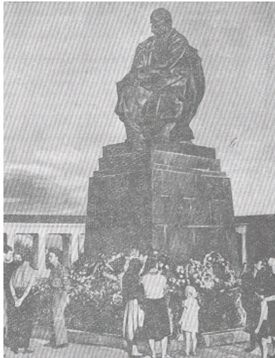
Орск. У памятника Т. Г. Шевченко