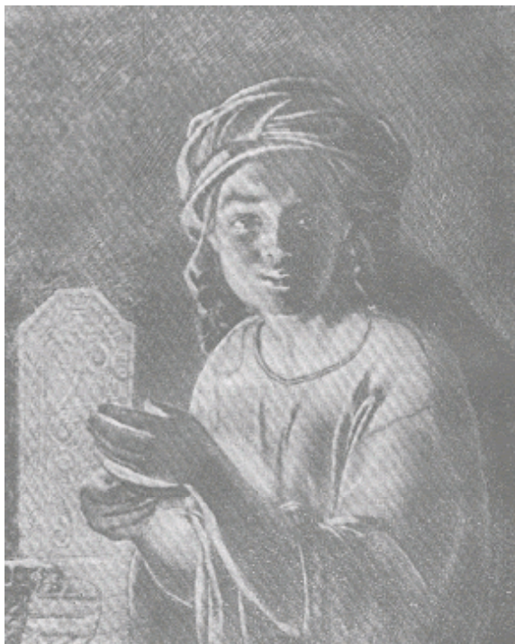
Казашка Катя (с работы Т. Г. Шевченко)