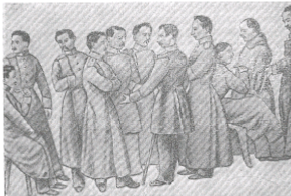
Т. Г. Шевченко среди ссыльных поляков (с рисунка А. Ф. Чернышева)

Созданный в один из дней конца 1849 - начала 1850 года, он впервые увидел свет в 1911-м, в Кракове, и только десятки лет спустя, уже после второй мировой войны, возвратился на свою родину.