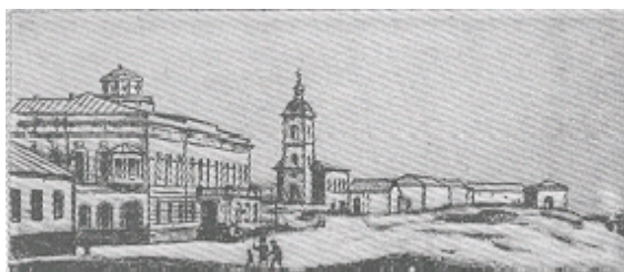
Оренбург. Дом генерала-губернатора.

«...Солнце только что закатилось, когда я переправился через сакмару, и первое, что я увидел, это было ещё розоватого цвета огромное здание с мечетью и прекраснейшим минаретом. Это здание называлось здесь Караван-сарай, мне открылся город,