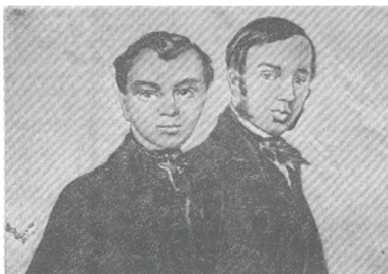
Братья Лазаревские (с портрета работы Т. Г. Шевченко]

"Он первый не устыдился моей серой шинели, и первый встретил меня по возвращении моем из Киргизской степи, и спросил, есть ли у меня что пообедать. Да, подобный привет дорог..."