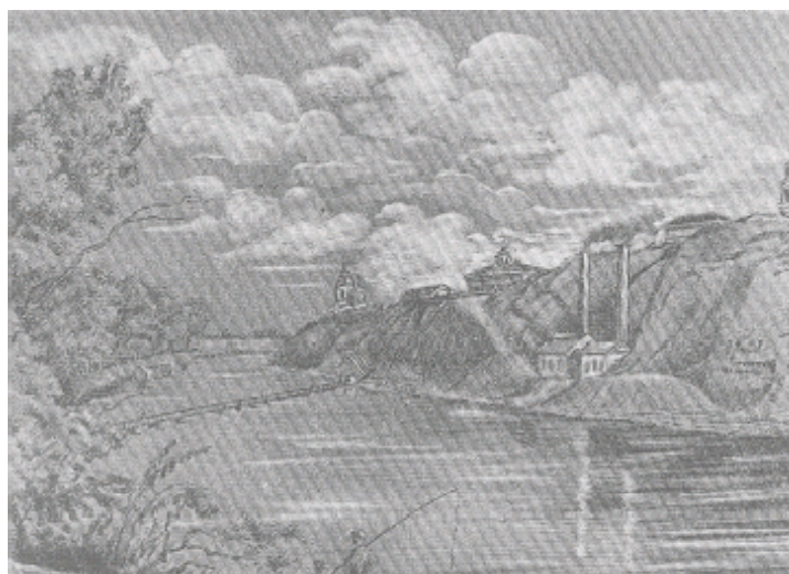
Оренбург. На берегу Урала.

Настолько тяжелыми оказались обстоятельства тех семи месяцев, так рьяно тогдашние властители человеческих судеб заботились о превращении гениального поэта в безвестного солдата, что многое, очень многое из его биографии и поныне остается загадкой.