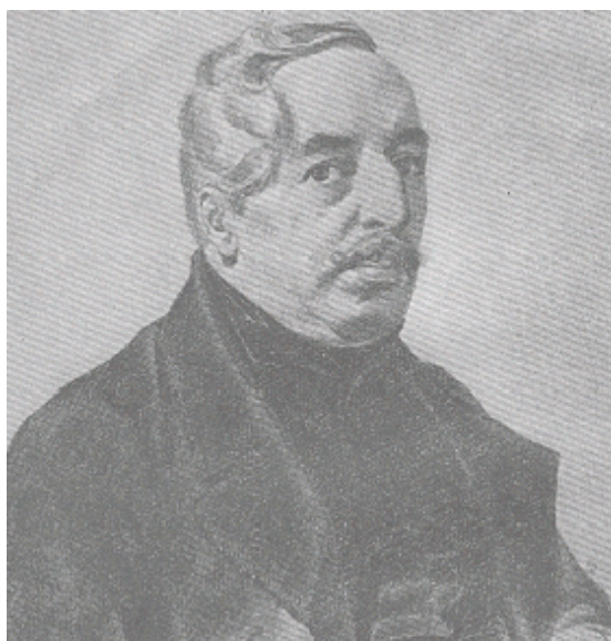
Портрет А. В. Племянникова (с работы Т. Г. Шевченко]