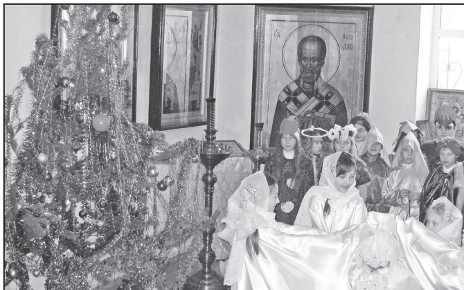
Возлюбленные о Господе всечестные отцы, боголюбивые иноки и инокини, дорогие братья и сестры!

Такие строки содержатся в поздравлениях, присланных в адрес адамовцев губернатором Оренбуржья Юрием БЕРГОМ и председателем ЗС области Сергеем ГРАЧЕВЫМ .