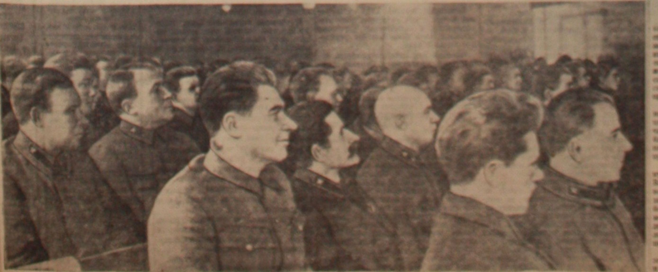
В зале заводской собрания партийного актива Оренбургской железной дороги.