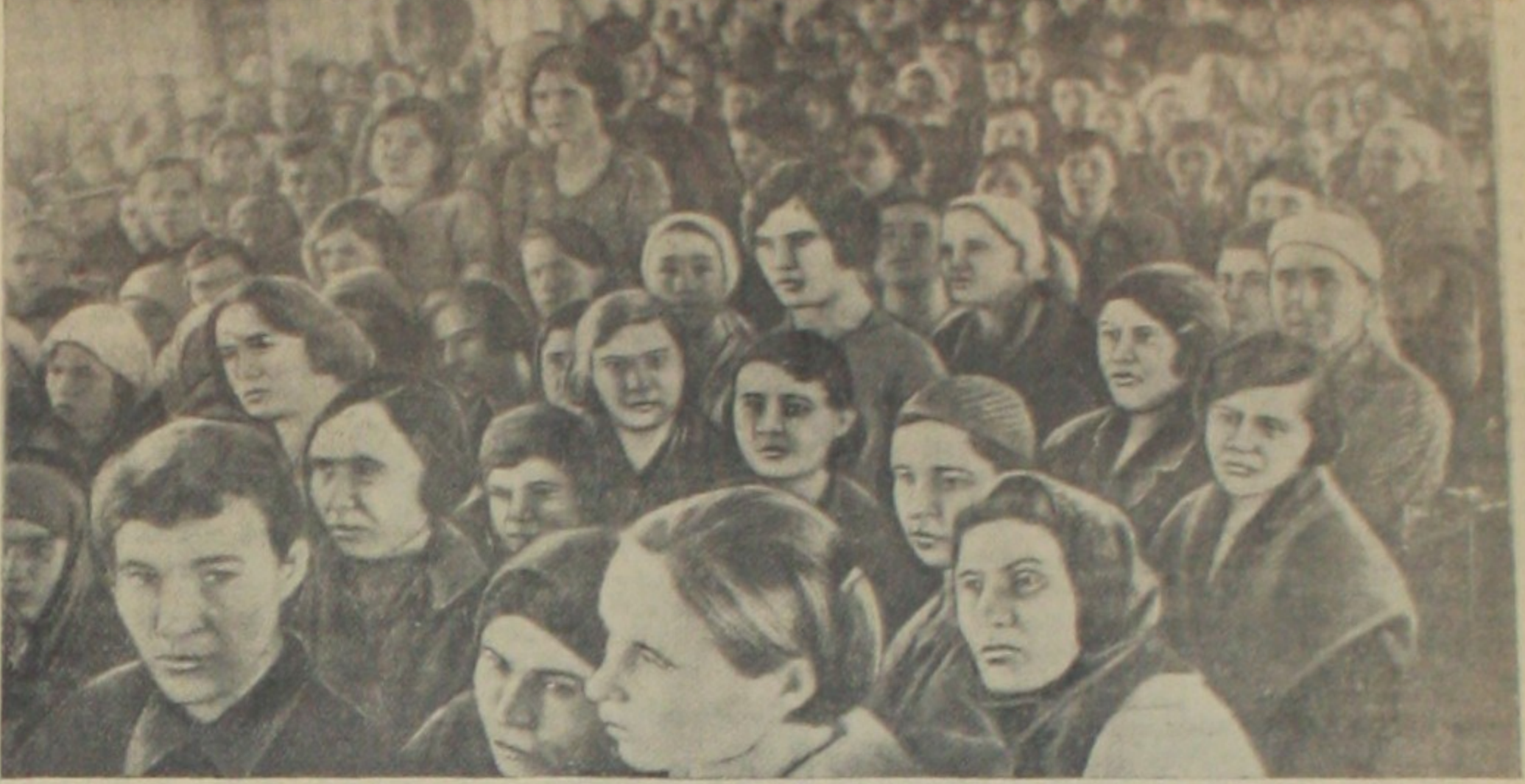
Митинг работников, рабочих и инженерно-технических работников чкаловской швейной фабрики имени Сталина по обсуждению обращения рабочих московского завода «Красный пролетарий» о всеобщем соревновании имени Третьей Сталинской Пятилетки.

Замечательными производственными победами демонстрировал вчера коллектив чкаловского завода имени Кирова свой высокий производственный и политический подъем, вызванный историческими решениями XVIII съезда ВКП(б). Квартальный план выполнен досрочно — 25 марта. На 129 процентов выполнен мартовский план.