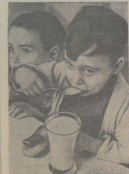
В республиканской Испании. НА СНИМКЕ: за завтраком в од-ном из детских садов Барселоны.

ВАШИНГТОН, 14 января. (ТАСС). Государственный департамент США опубликовал германскую ноту от 30 декабря 1937 года в ответ на американ-скую ноту от 14 декабря. В своей но-те США требовали от германского пра-вительства гарантий о неприменении антисемитских законов к американским гражданам, проживающим в Германии. Германское правительство в своем от-вете отказывается дать такие гаран-тии и просит США привести конкрет-ные случаи дискриминации умаления прав (американских евреев). Правитель-ство США 7 января в новой ноте ори-ентировочно указывает на такой дискри-минации и снова повторяет, что оно отказывается признать за Германией право применять антисемитские зако-ны к американским гражданам.