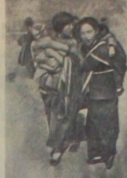
И военным действиям в Китае. Итальянские захватчики продолжают парировать бомбардировки мирных китайских городов и селений.