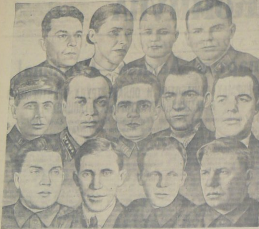
Делегаты члновской областной парторганизации на XVIII съезде ВКП(б) (в первом ряду сзади)...