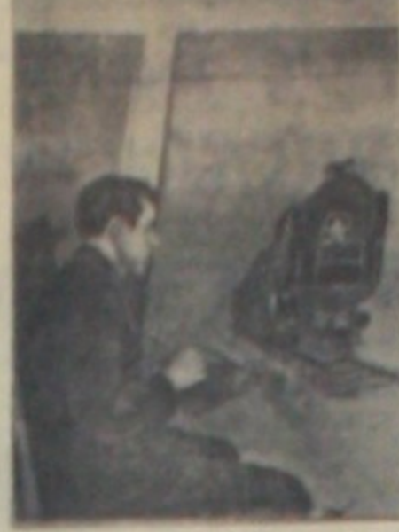
Подготовка к 1 мая. На снимке: судья...