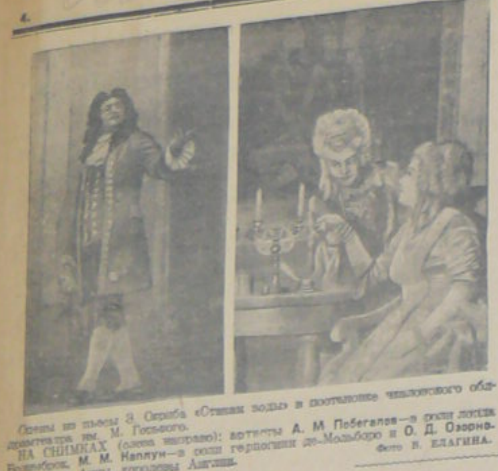
Сцена из пьесы Э. Скриба «Стакан воды» в постановке чкаловского областного театра.

Статья утверждает, что в Европе наблюдается острый недостаток продовольствия, особенно в тех странах, которые не имеют выхода к морю.