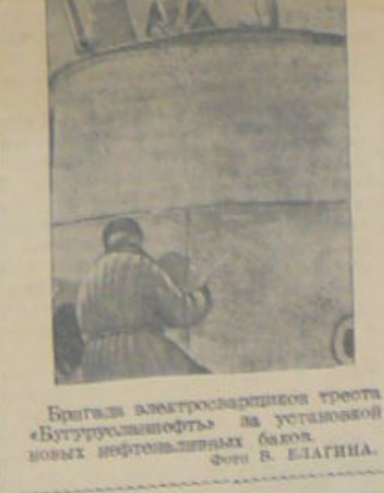
Бригада электросварщиков трудится в колхозе на установке новых нефтяных баков.

В тех районах, где сосредоточены в основном колхозники, это послужило мощным средством укрепления трудовой дисциплины. В период по области количество колхозников, не выработавших установленной нормы труда и не прекративших участия в колхозном производстве, еще весьма велико. Правда, и большинство колхозов стремятся отдаленных колхозников увести за счет колхоза или по-прежнему отор. За 1940 год число колхозников, не участвовавших в производстве, уменьшилось по сравнению с 1939 годом на 2.399 человек, а число не выработавших нормы труда — на 8.434.