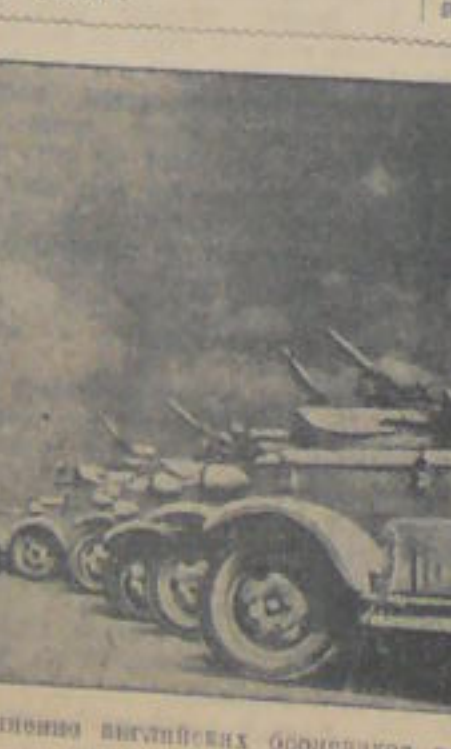
Соединены восточные бронепоезда в Западной пустыне.