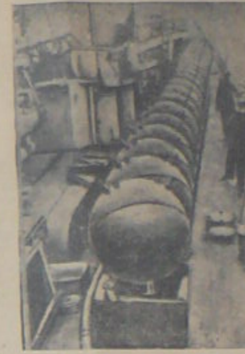
НА СНИМКЕ: члены на германском митинге.

Газета утверждает, что Рузвельт пытается отвлечь внимание от своего поражения в войне против Японии.