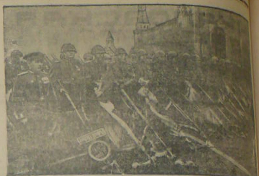
Парад Победы на Красной площади в Москве 24 июня 1945 г. Впереди — солдаты Красной Армии, в центре — солдаты союзных армий, в конце — солдаты немецкой армии.