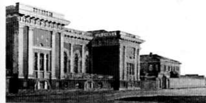
Здание благородного собрания. XIX век. С рисунка В. В. Дорофеева

Премьеры выливались в праздники для всего Оренбурга. Билеты обычно расхва-