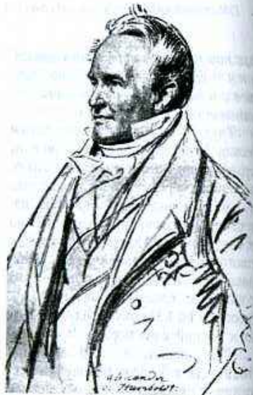
Портрет Гумбольдта. 1829 г.

Много внимания уделяет Розе одному из сопровождавших их солдат — молодому поляку Ивану Виткевичу. Речь идёт об И. В. Виткевиче (1809 — 1839), который впоследствии стал адъютантом оренбургского военного губернатора и сотрудником Оренбургской Пограничной комиссии и прославился дипломатическими поездками в Бухару и Афганистан. 3 Розе пишет: «Он был воспитанником гимназии в Кроже Виленской губернии, но четырнадцатилетним юношей вместе с несколькими товарищами был по политическим мотивам ещё при императоре Александре сослан в Орск и приговорён пожизненно оставаться казаком. Виткевич использовал в Орске своё свободное время для изучения восточных языков, особенно тюркско-киргизского диалекта, персидского и арабского, для чего в Орске у него были условия, достиг в этом большой сноровки и, возможно, поскольку при восшествии на престол императора Николая ему не открывалось никаких видов на лучшую участь, имел намерение при первой возможности убежать через киргизские степи и таким