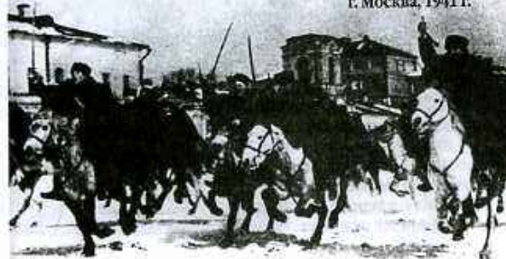
Занятия по боевой подготовке на Хамовницком плацу. Кавалерийская атака 4-го эскадрона 256-го кавполка. г. Москва, 1941 г.