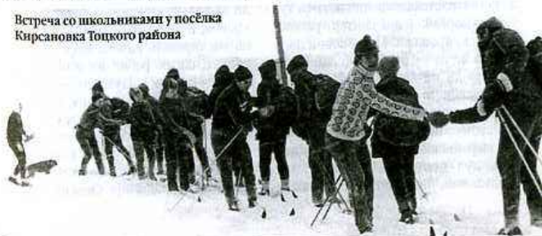
Встреча со школьниками у посёлка Кирсановка Тоцкого района