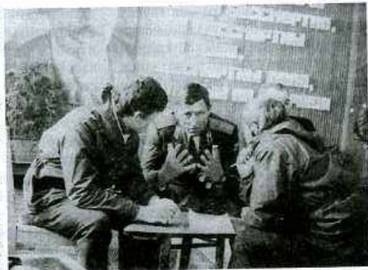
Члены экспедиции в с. Тоцком, в воинской части

лось. А кроме этого мы читали лекции, проводили беседы в школах, ГПТУ, Домах культуры. Темы лекций актуальны — о подвиге комсомольцев Оренбуржья в годы войны. Как пригодились первые встречи с ветеранами!