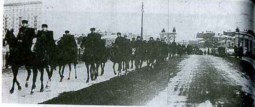
Марш 256-го кавалерийского полка 11-й Морозовской кавдивизии из Москвы по Калужскому шоссе на фронт. Февраль, 1942 г.