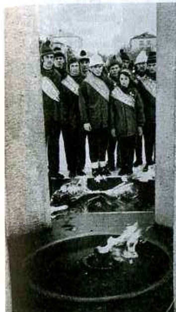
Члены экспедиции «Звезда» у Вечного огня в саду им. Фрунзе, г. Оренбург