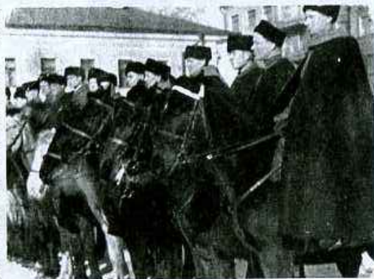
Миномётная батарея 256-го кавполка. 14 июля 1942 г.

После переименования дивизии в неё хлынул поток заявлений казаков о желании служить в старейшем казачьем соединении. Только из 348-й стрелковой дивизии в 11-ю Отдельную кавалерийскую дивизию им. Ф.М. Морозова шло 262 казака. По окончании её комплектования