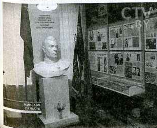
В музее героев партизанской бригады

В сумерках, когда по гостям ходить было уже поздно, всей компанией отряд «Звезда» отправился