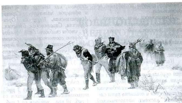
И. Праннишников. Французы в 1812 г., пленённые ополчением

военнопленные использовались на хозяйственных работах, владеющие профессиональными навыками привлекались на работы на фабриках, заводах. Так, в Оренбургской инженерной команде были и пленные французские офицеры.