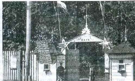
Оренбург. Вход в Тополёвый сад

После заседания школьной комиссии городской думы, рассмотревшей вопрос «Об организации в городе Оренбурге разумных развлечений для населения», 13 марта 1915 года на обсуждение местных депутатов