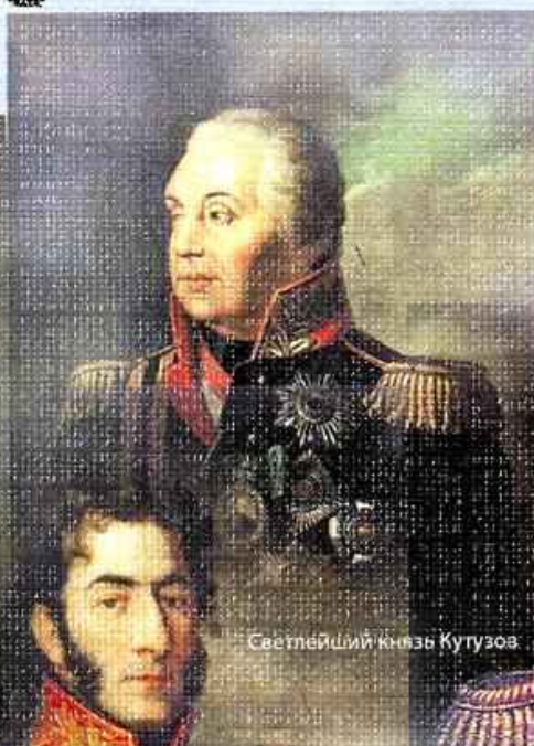
Светлейший князь Кутузов