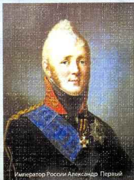
Император России Александр Первый