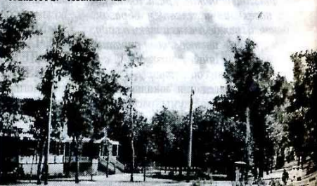
ОРЕНБУРГЪ. Тополёвый садъ.

В «Отчёте о состоянии народного образования в г. Оренбурге за 1915 год» (далее «Отчёт» — Т.С.), опубликованном в «Оренбургских городских известиях», несколько страниц посвящено деятельности детской площадки в Тополях: «Действия свои площадка открыла 24 июня в 5 часов вечера, о чём зара-