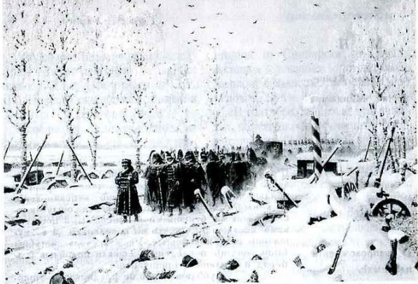
В. Верещагин. Отступление

скольку во второй партии пленных более 1000 человек, для которых нужно не менее 200 подвод.