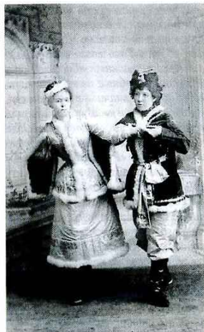
Дети в костюмах для спектакля

Для пения был приглашён специалист, разучивавший с детьми песенки, предусмотренные педагогическим собранием. Пение ве-