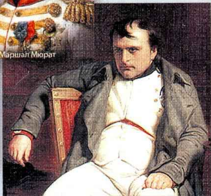
Император Франции Наполеон Бонапарт