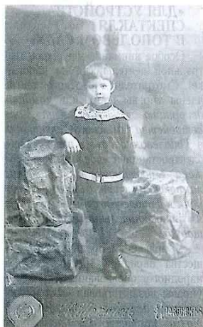
Фотография мальчика. Начало XX века

ми посетителями летних площадок, утверждала: «Удобнее всего для малышей ставить спектакли в Тополёвом саду, так как там есть, где поиграть и побегать во время антракта».