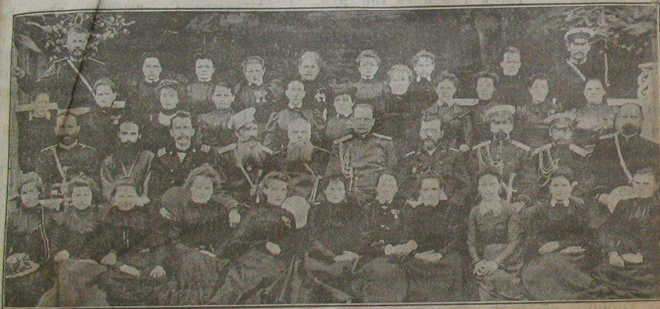
Группа учительницъ на съездѣ.

(См. №№ 1278, 1281, 1285, 1286, 1289, 1290, 1291, 1298).