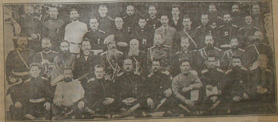
Группа учителей на съездѣ.