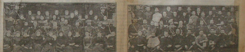
Группа учителей на съезде.

Въ създу учителей и учителейницъ станичныхъ и писельниковъ шюль Оренбургскъхъ начальныхъ шюль.