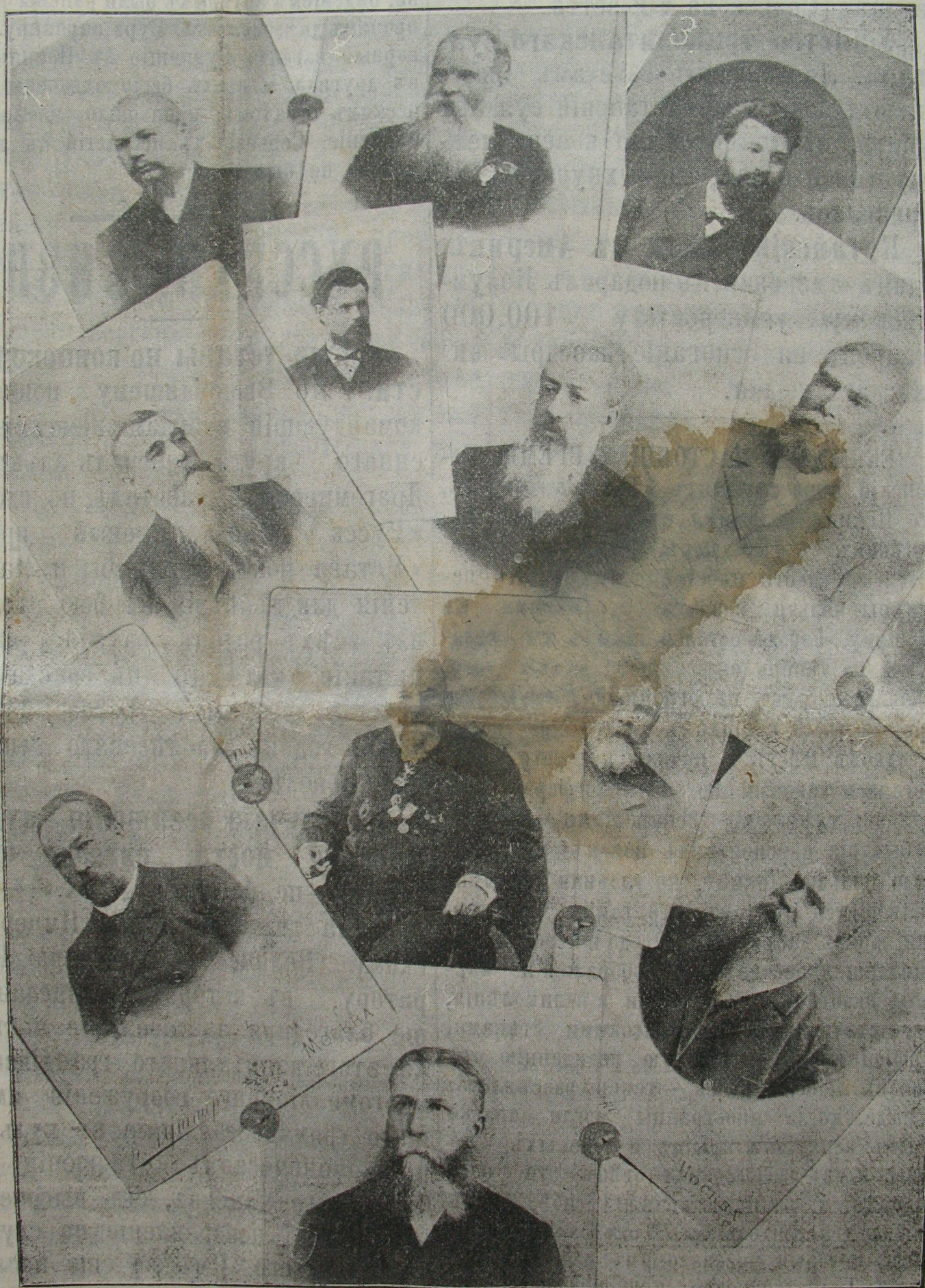
Совѣтъ и правленіе оренбургскаго общества взаимнаго кредита.

Ко дню XXV лѣтія оренбургскаго общества взаимнаго кредита