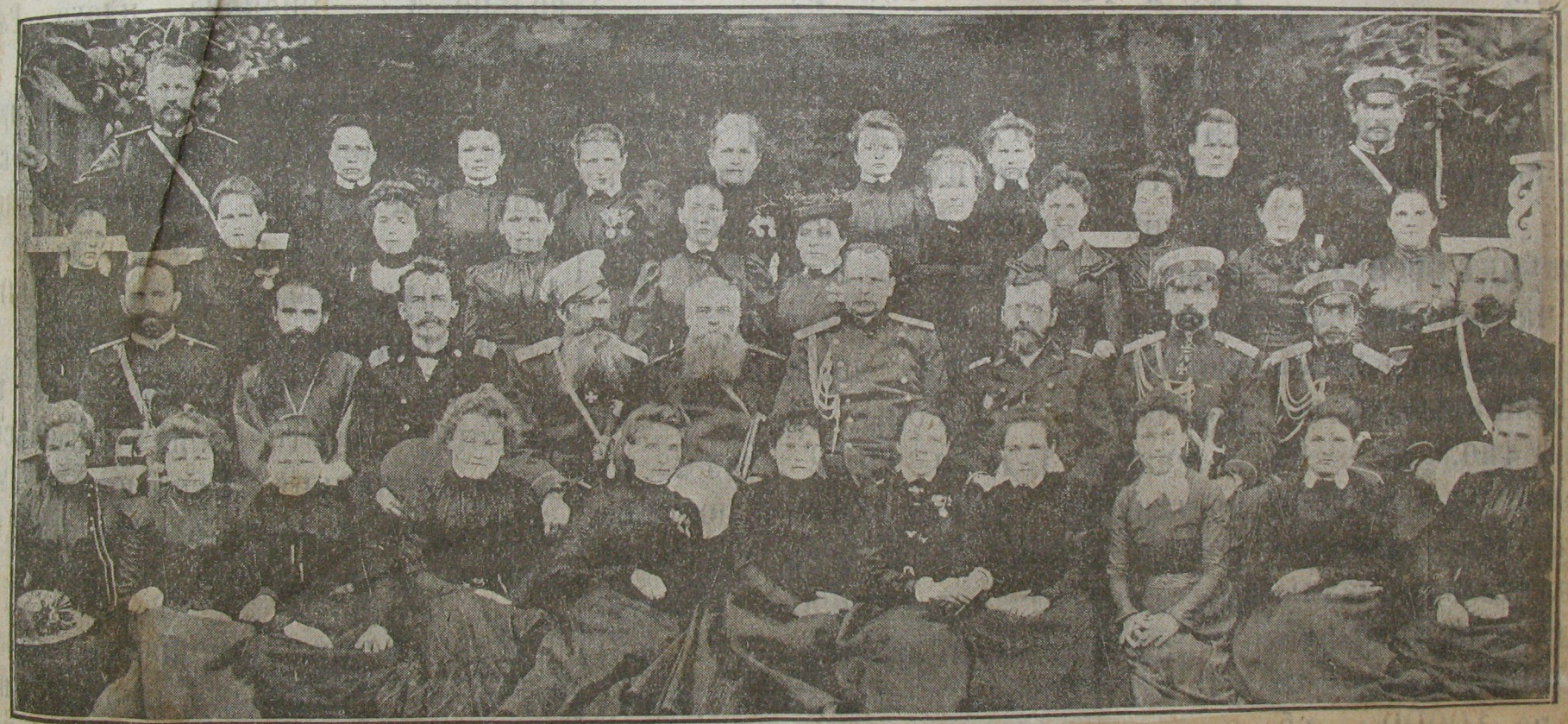
Группа учительницъ на съѣздѣ.

къ съѣзду учителей и учительницъ станичныхъ и поселковъ (См. №№ 1278, 1281, 1285, 1286, 1