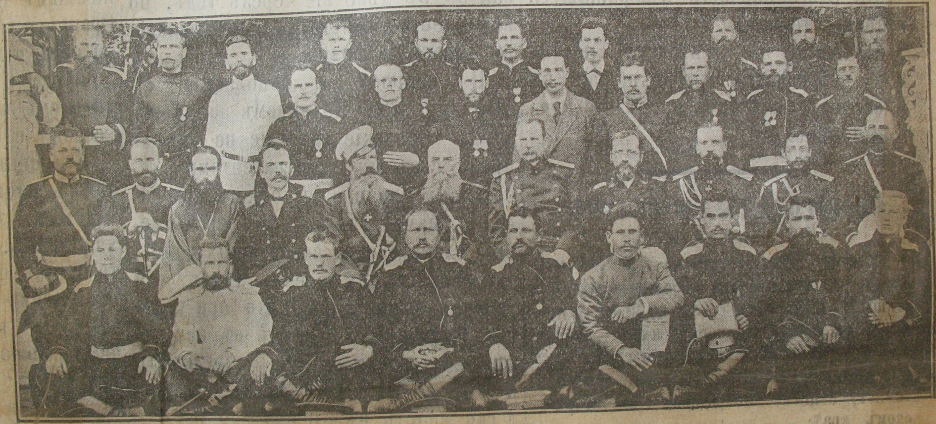
Группа учителей на съезде.

селковых школ оренбургских казачьих войск. (1286, 1289, 1290, 1291, 1298).