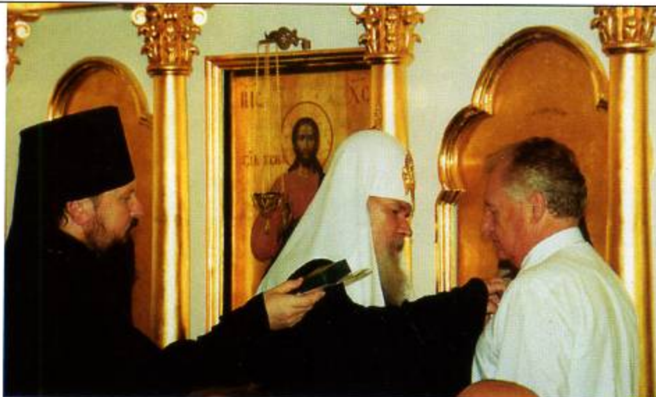
Патриарх Московский и всея Руси Алексий II вручает В. И. Гречушкину медаль Русской православной церкви преподобного Сергия Радонежского 1-й степени за проявленную заботу о детях России.

Но я верю, что все наладится, что Россия займет свое достойное место среди великих держав мира, сделает своих граждан богатыми и счастливыми. Эту цель и преследуют национальные проекты, разработанные по инициативе президента Российской Федерации.