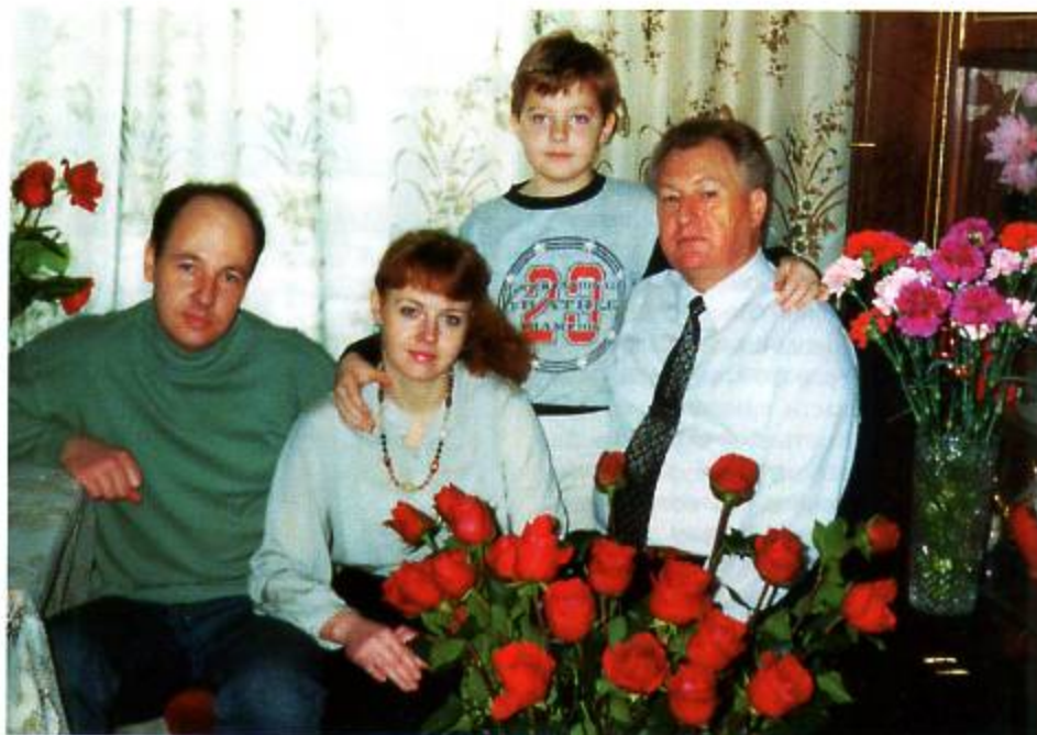
На одном из семейных праздников