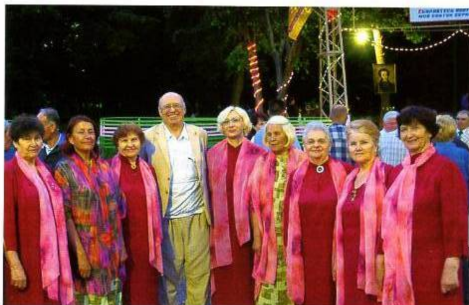
Женский хор «Голоса отрады»

Яркое солнце, тенистая прохлада укромных уголков тимашевского парка, разноголосый гомон птиц в густых кронах вековых деревьев - все это настраивало душу на возвышенный лад, вселяло надежду на то, что не все коренные устои нашего русского жизненного уклада утеряны безвозвратно... ■