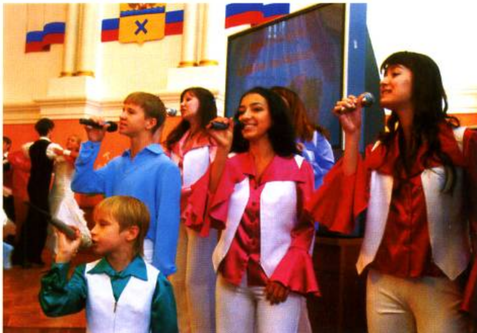
Прием у мэра в День учителя. 2005 г.

Национальный проект «Образование» касается не только обычных школ, гимназий и лицеев, но и учреждений системы дополнительного образования. Многим из них предстоит кардинально пересмотреть формы и методы привлечения детского контингента к занятиям во внеурочное время. А вот городской Дворец творчества детей и молодежи уже несколько лет назад предпринял серьезные шаги для углубления и расширения своей деятельности на основе собственной образовательной концепции.