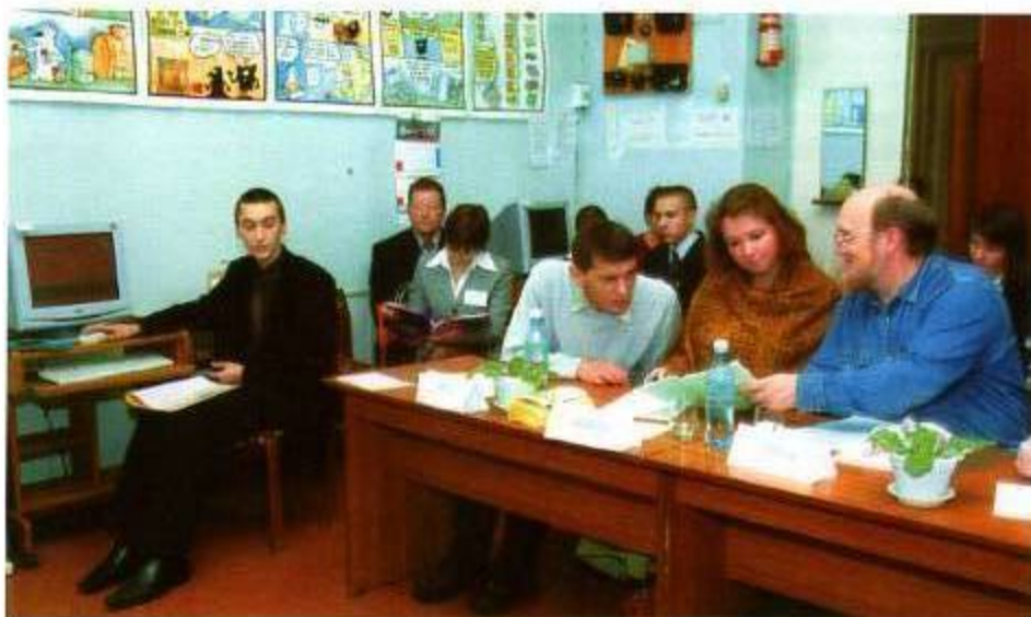
Секция математики. Чья то работа вызвала оживленную дискуссию

Серьезным стимулом к дальнейшим занятиям в «Интеллекте» становятся публикации трудов его воспитанников в различных научных изданиях, таких, как журнал Обнинского института атомной энергетики, журнал «Клиническая анатомия и экспериментальная хирургия» Всероссийского общества анатомов, гистологов и эмбриологов, сборники тезисов научно-практических конференций, проводимых оренбургскими университетами и медицинской академией. Юные журналисты нередко печатаются в местных газетах, а самые талантливые прозаики и поэты увидели свои литературные опыты на страницах областных, реги-