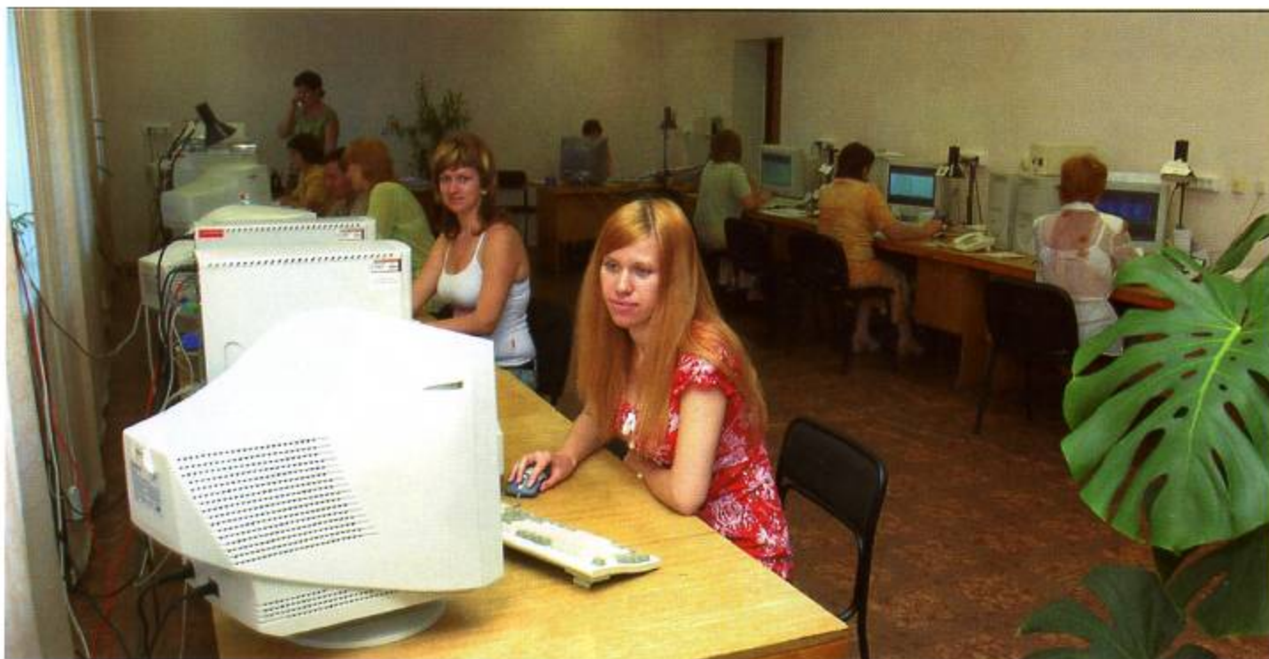
Компьютерный зал Оренбургстата

мической информацией. Текущая статистика была организована по всем отраслям народного хозяйства, год от года совершенствовалась постановка оперативной отчетности.