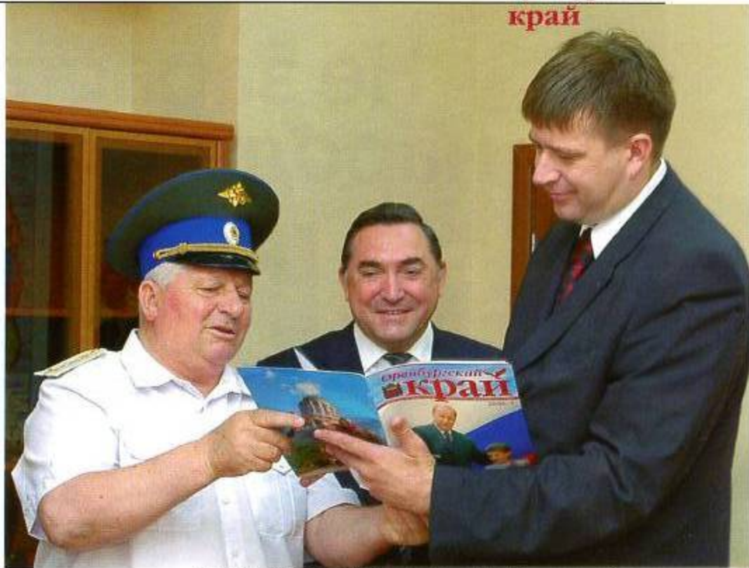
Юрий Бельков и главный федеральный инспектор Петр Капшиников поздравляют полпреда Президента РФ в ПФО Александра Коновалова с днем рождения

Особняком стоит восстановление знаменитой усадьбы дворян Тимашевых, что в Ташле Тюльганского района. Это место известно тем, что 150 лет было «родовым гнездом» известного в России рода. Здесь