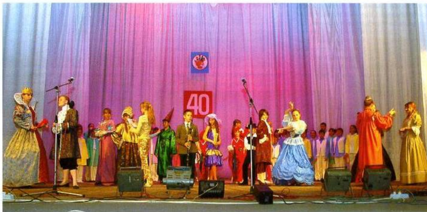
Юбилейный концерт ДШИ № 2 им. А. С. Пушкина