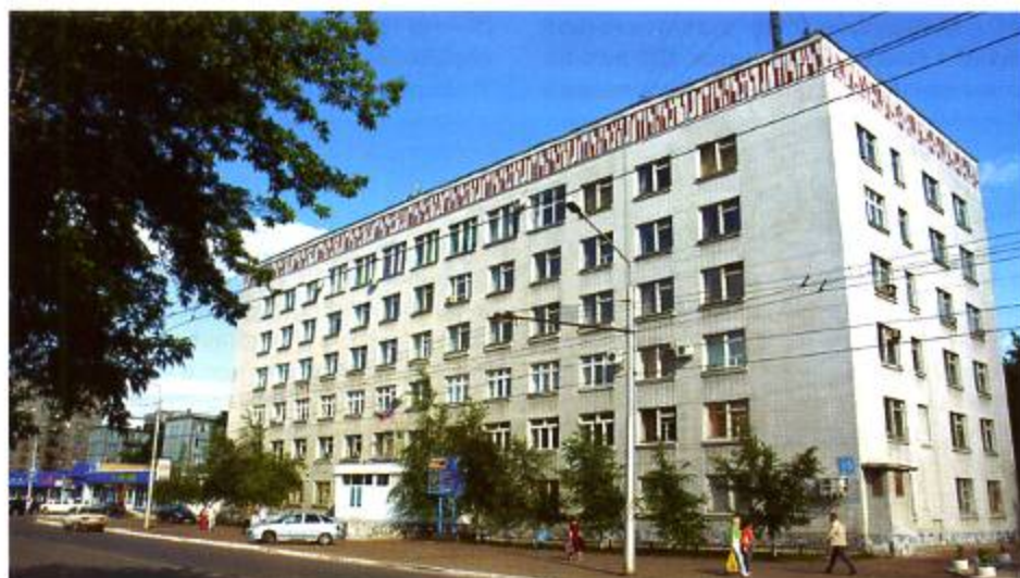
Современное здание Территориального органа Федеральной службы государственной статистики по Оренбургской области (Оренбургстата) по ул. Туркестанской, 15

Информационные ресурсы Оренбургстата дают возможность структурным подразделениям органов исполнительной власти области и местного самоуправления для