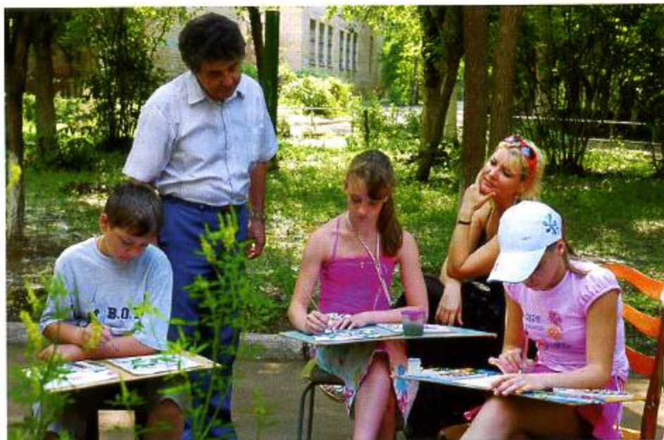
Юные художники на пленере

Создание хореографического и особенно театрального отделений требовало определенного материального обеспечения. Ведь для каждого спектакля нужны новые костюмы и декорации. Покупать их или заказывать в ателье - удовольствие дорогое. Геннадий Алексеевич Перов нашел оригинальный