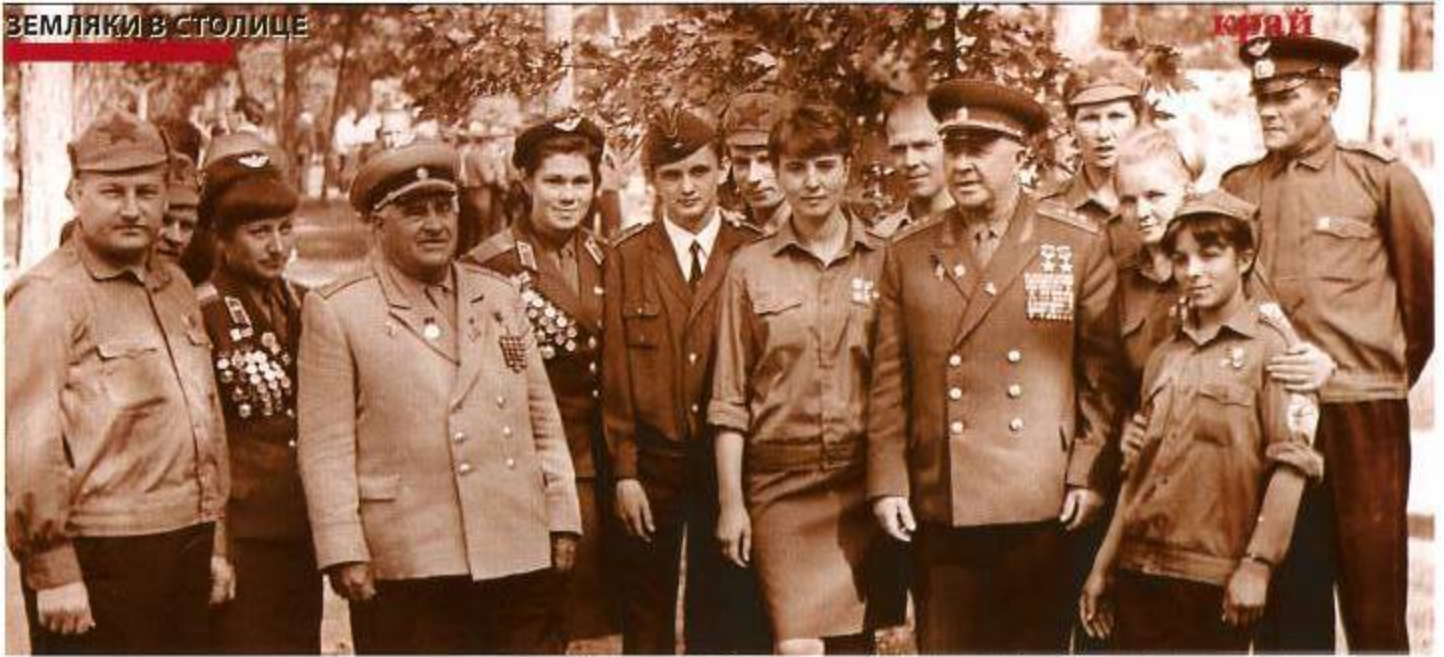
На Всесоюзном слете комсомольцев и молодежи в г. Ленинграде оренбургская делегация вместе с прославленным земляком, дважды Героем Советского Союза генерал-полковником А. И. Родимцевым, 1967 г.

сак избирался комсоргом. В период учебы в Оренбургском государственном педагогическом институте входил в состав профкома вуза. Тогда же был принят в члены КПСС. Кстати, заявление о приеме в партию я написал не из соображений карьерного роста. Мне было предложено это сделать, наверное, потому, что я своей учебой, общественной позицией, мировоззрением выделялся на факультете.