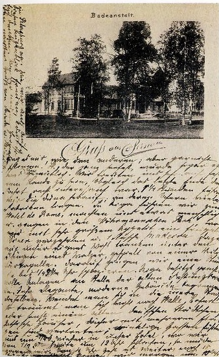
Открытое письмо «Водо- лечебница. Привет из Пярну» Лицевая и обратная сто- роны Изд.: Оскар Неринг, Пяр- ну (Пернов) 1894 г.

Кисловодске, Ялте, Екатеринбурге, Чите, Уфе и других — свои издательства или издатели, специализировавшиеся на выпуске почтовых открыток. Издателями чаще всего выступали владельцы всевозможных магазинов, иногда вообще не имевшие отношения к писчебумажной продукции. Тем не