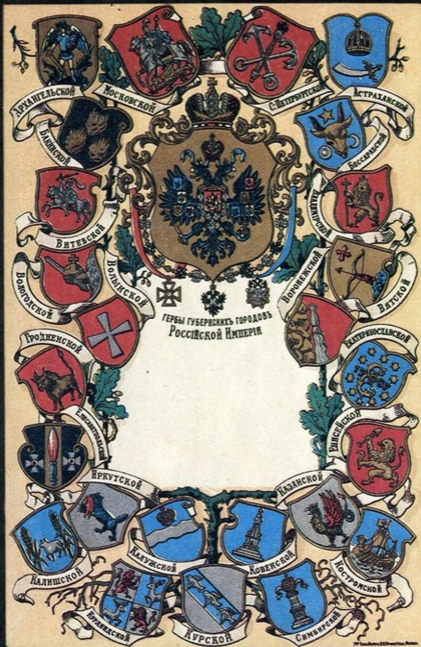
ГЕРБЫ ГУБЕРИЙСКИХ ГОРОДОВ РОССІЙСКОЙ ИМПЕРІИ