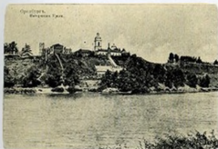
Оренбург Набережная Урала Изд.: Фотографический ма- газин М. Шанина, Сама- ра — Оренбург № 216, 1900-е гг.