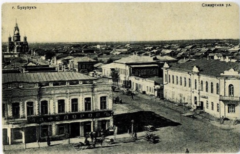
Бузулук Самарская улица Изд.: Фотограф И. П. Жиллинский, Бузулук 1900-е гг.