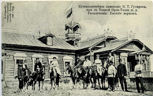
Кумысолечебное заведение Н. Т. Гусарова, при ст. Тоцкой Орен-Ташк. ж. д. Развлеченія: Катаніе верхомъ.

Изд.: жит. Фотограф В. Г. По- ловников, Челябинск. Оренбургъ.