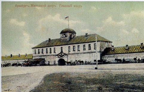
Оренбург. Меновой двор. Главный вход