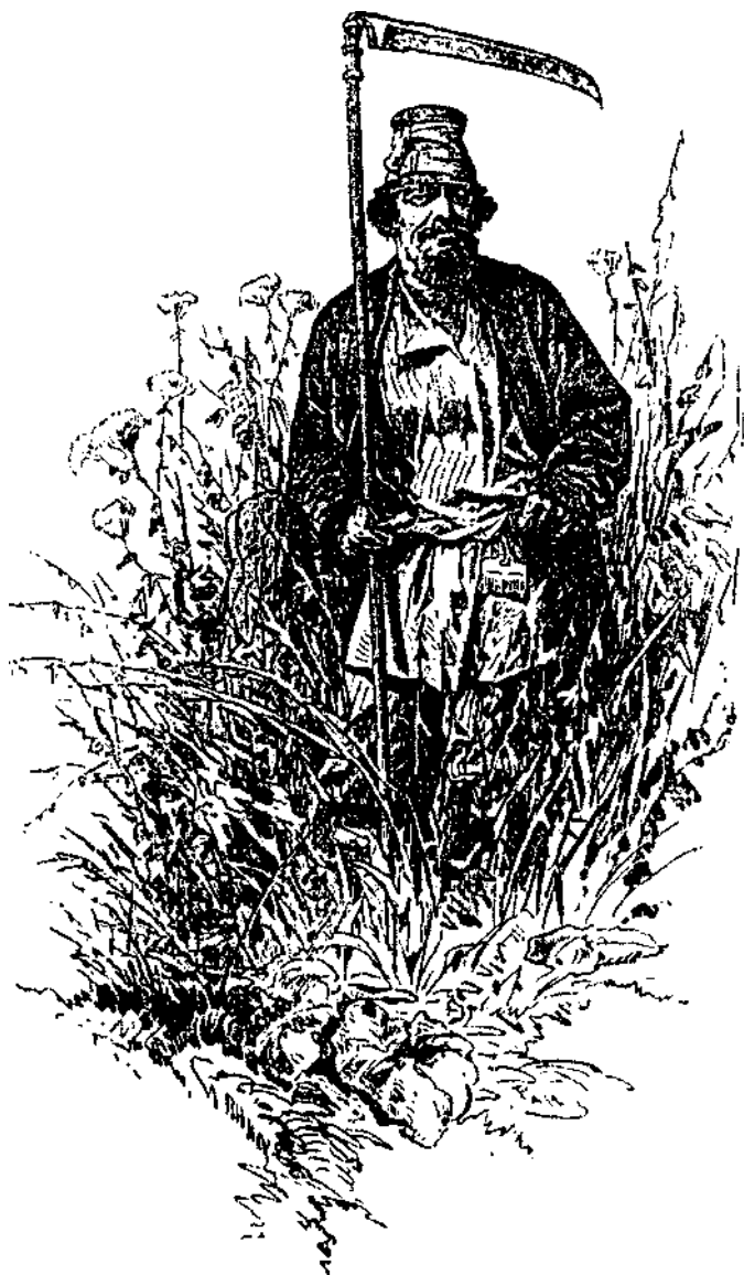
Русский крестьянин с гребешком-оберегом на поясе.

рекруты; указ 13 декабря 1760 г. позволяет помещикам ссылать своих крепостных в Сибирь.