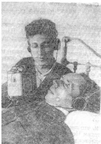
Н. Островский у микрофона. Сочи. 1935 г.

Это, пожалуй, единственное письмо самого Островского к уральцам, увидевшее пока свет в собраниях сочинений писателя.