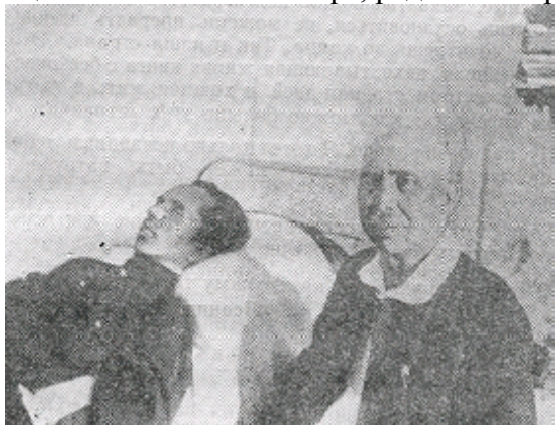
Н. Островский и А. С. Серафимович. Сочи 1934 г.

Вот это тяжело мне. Тяжело, что я бесполезный член общества. Особенно бывает тяжело, когда читаешь в газетах или слушаешь по радио, о славной жизни в нашей стране, о великих делах, творимых Стахановым, Бусыгиным, Марией Демченко и сотнями тысяч их последователей. Эти сообщения вызывают восторг, радость и гордость, и в то же время где-то в глубине души